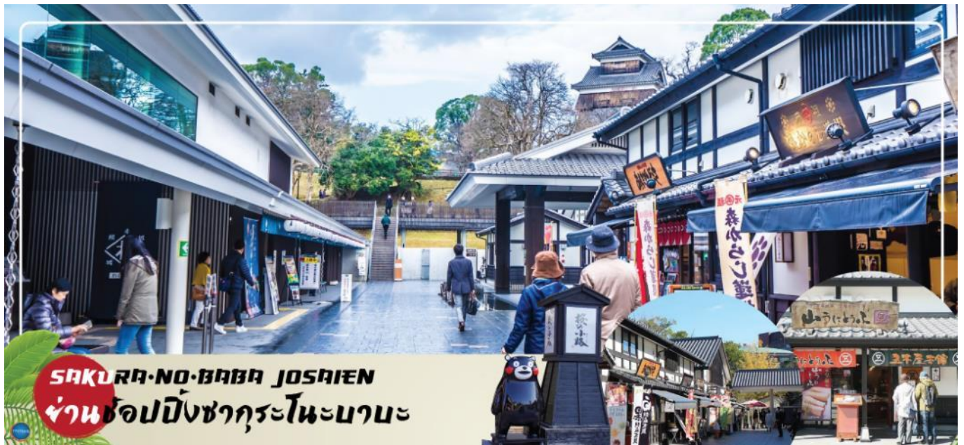
SAKURA-NO-BABA JOSAIEN ย่านช้อปปิ้งซากุระโนะบาระ

วันที่สอง ท่าอากาศยานนานาชาติฟุกุโอกะ ประเทศญี่ปุ่น – จังหวัดคุมาโมโตะ – ปราสาทคุมาโมโตะ – ย่านช้อปปิ้งซากุระโนะบาระ โจไซเอน – คมมะงสแควร์ – ฟุททูกุคชะเซนริ – เมืองเบปปุ – แพลนออนเซ็นธรรมชาติ