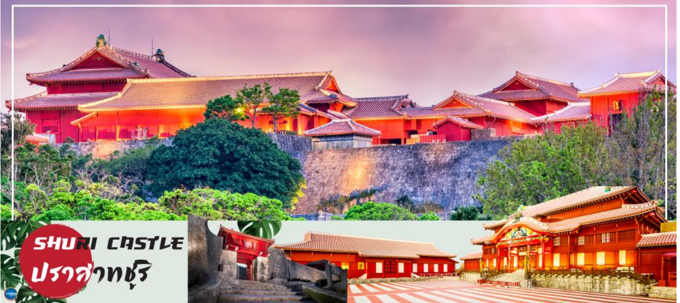
SHURI CASTLE ปราสาทชुरิ

** ชำระค่าทัวร์ในนามบริษัท ไลออน ทราเวล จำกัด เท่านั้น **