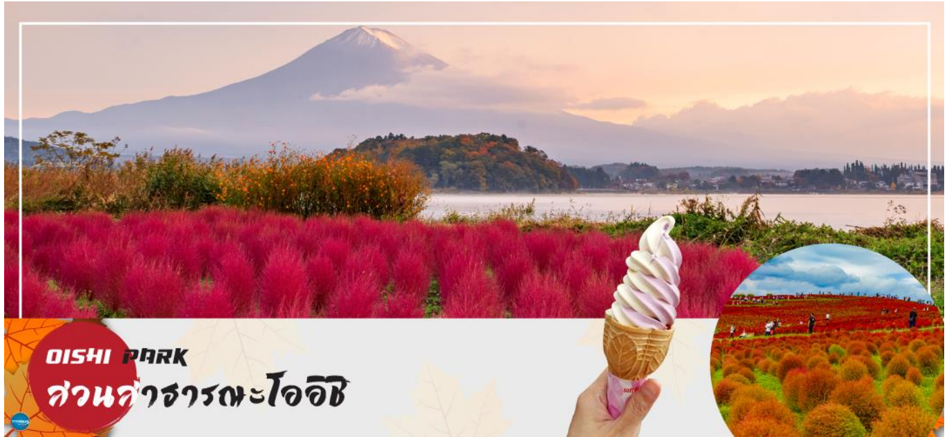
OISHI PARK สวนสาธารณะโออิชิ

จากนั้นนำท่านสู่ สวนสาธารณะโออิชิ (Oishi Park) (ใช้เวลาเดินทางประมาณ 30 นาที) ที่มีภาพ ภูเขาฟูจิซึ่งเป็นฉากหลังของทะเลสาบคาวากูจิติดกันกับภาพทุ่งดอกไม้ตามฤดูกาลอย่างสวยงาม อิสระให้ท่านได้วิ่งเล่นท่ามกลางทุ่งดอกไม้ สัมผัสกลิ่นหอมสดชื่น และเพลิดเพลินกับทิวทัศน์ อันงดงาม พร้อมเก็บภาพความประทับใจตามอัธยาศัย (ช่วงกลางเดือนตุลาคม - ต้นเดือน พฤศจิกายน ชมทุ่งดอกไม้โคเคียวเปลี่ยนสีเป็นสีแดงอมน้ำตาลทั้งนี้ขึ้นอยู่กับสภาพอากาศ)