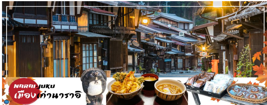
NARAI JUKU เมืองเก่านาราจิ

นำท่านสู่ เมืองนาราจิ จุก (Narai Juku) (ใช้เวลาเดินทางประมาณ 1 ชั่วโมง) ตั้งอยู่ในแถบหุบเขาชิโอะ จังหวัดนากาโนะ เป็นย่านเมืองเก่าสมัยเอโดะ เป็นเมืองที่ตั้งอยู่กลางทางระหว่างเกียวโตกับเอโดะ บนเส้นทางนาคะเซนโดะ ผู้คนผ่านไปมาสองเมืองนี้ ก็จะต้องผ่านเมืองนาราจิ จนทำให้กลายเป็นเมืองที่มั่งคั่งที่สุดในหุบเขาชิโอะ เสน่ห์ของที่นี่คือ บ้านเมืองเก่าสีน้ำตาลเรียงรายสองข้างทางยาวกว่า 1 กิโลเมตร โดยมีวิวฉากหลังเป็นหุบเขาชิโอะ ไฮไลท์!!! สะพานคิโอะอิซาซาชิ เป็นสะพานที่อยู่เหนือแม่น้ำนาราจิ ซึ่งอยู่คู่ขนานกับถนนสายหลักในเมือง ที่นี้นับว่าเป็นสะพานไม้ที่ยาวที่สุดของประเทศญี่ปุ่นที่สร้างในช่วงปี 1990 เป็นสะพานที่สวยงาม