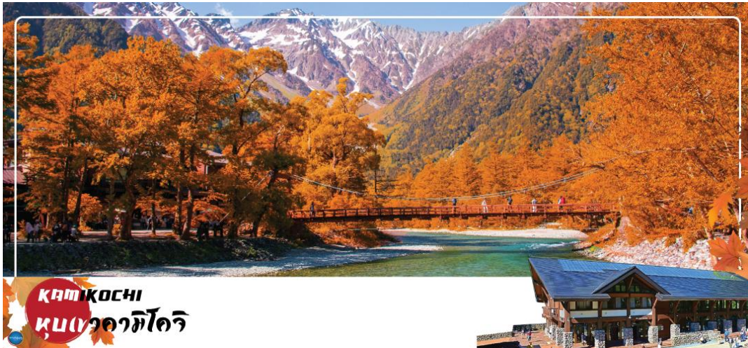
KAMIKOCHI หุบเขาคามิโคจิ

วันที่สี่ เมืองมัตสึโมโตะ – เมืองนากาโนะ – คามิโคจิ – สะพานกัปปะ – ย่านเมืองเก่านาราจิ จุก – เมืองนาโกย่า – ย่านชานาเคะ