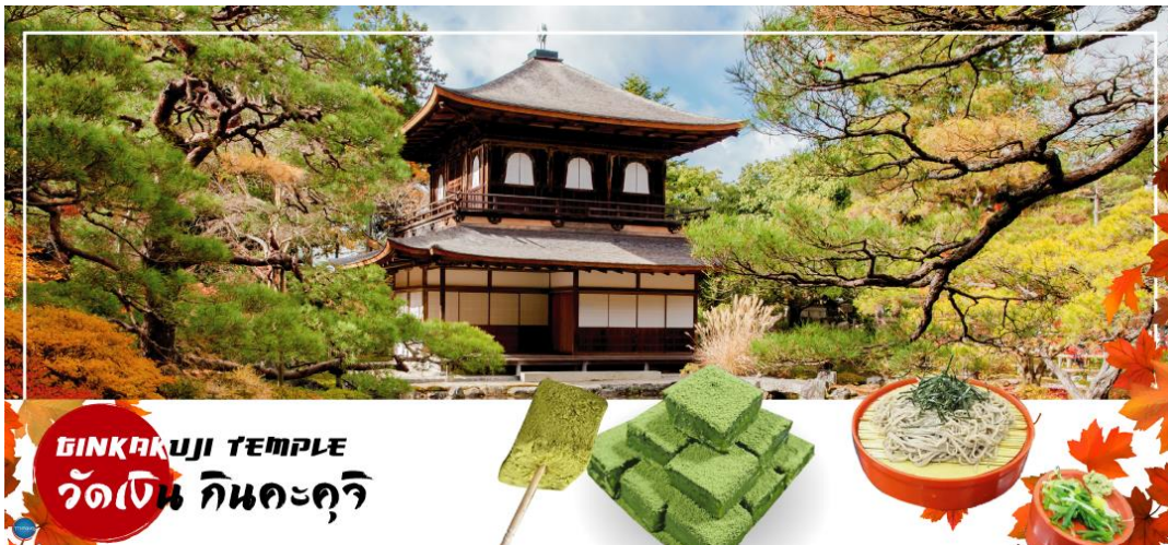
GINKAKUJI TEMPLE วัดเงิน กินคะคุจิ

วันที่ห้า เมืองนาโกย่า – เมืองเกียวโต – วัดกินคะคุจิ หรือ วัดเงิน – พิธีชงชาญี่ปุ่น – เมืองโอซาก้า – LALAPORT & MITSUI OUTLET PARK OSAKA KADOMA – ช้อปปิ้งย่านชินไซบาชิ