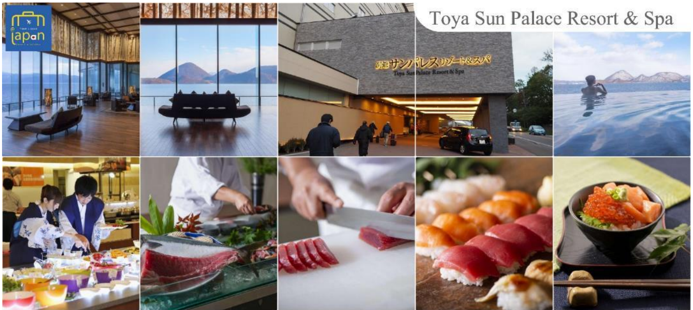
Toya Sun Palace Resort & Spa

รับประทานอาหารค่ำ ณ ภัตตาคาร ของโรงแรม (4) --- นูฟเฟ็ดนานาชาติ หลังอาหารให้ท่านได้ผ่อนคลายกับการแช่น้ำแร่ธรรมชาติ เชื่อว่าถ้าได้แช่น้ำแร่แล้ว จะทำให้ ผิวพรรณสวยงามและช่วยให้ระบบหมุนเวียนโลหิตดีขึ้น