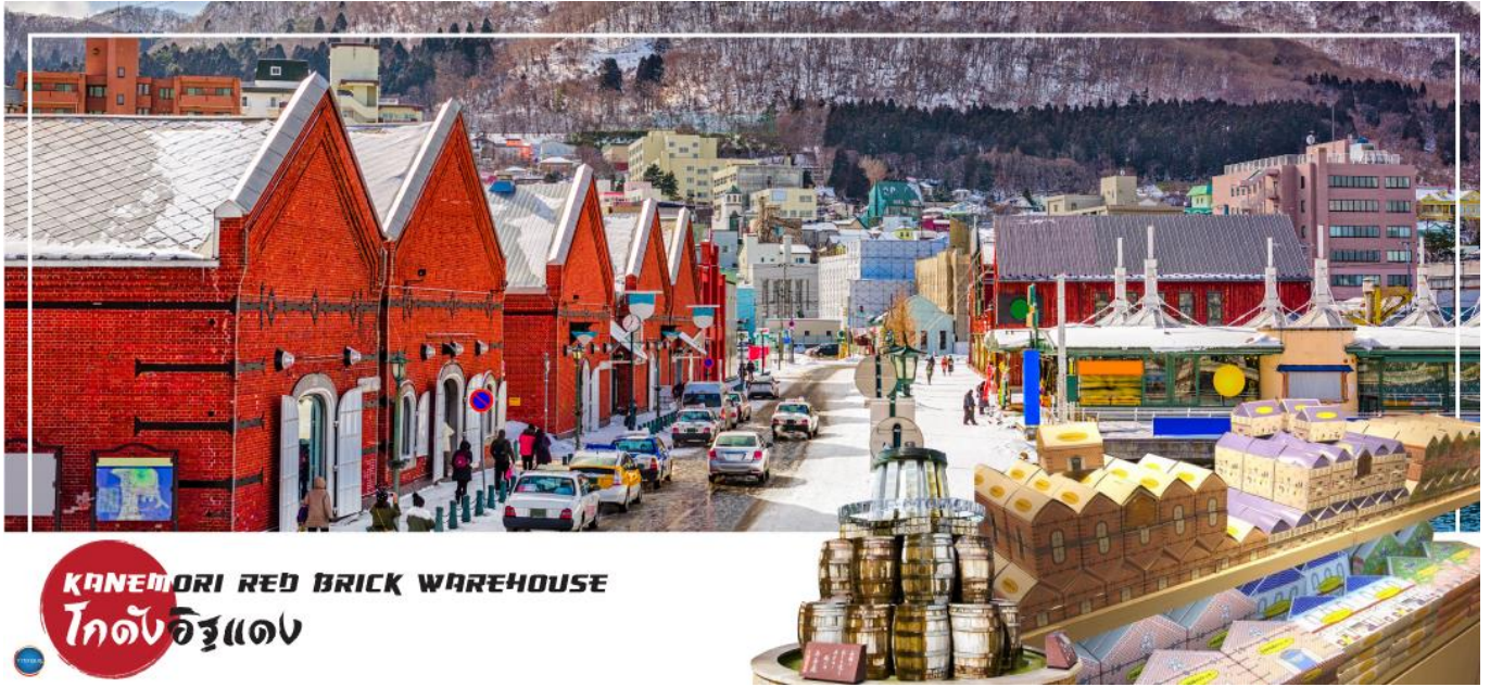
KANEMORI RED BRICK WAREHOUSE

** ชำระค่าทัวร์ในนามบริษัท ไลออน ทราเวล จำกัด เท่านั้น **