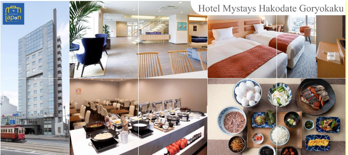
Hotel Mystays Hakodate Goryokaku

ที่พัก HOTEL MYSTAYS HAKODATE GORYOKAKU, HAKODATE หรือเทียบเท่าระดับเดียวกัน