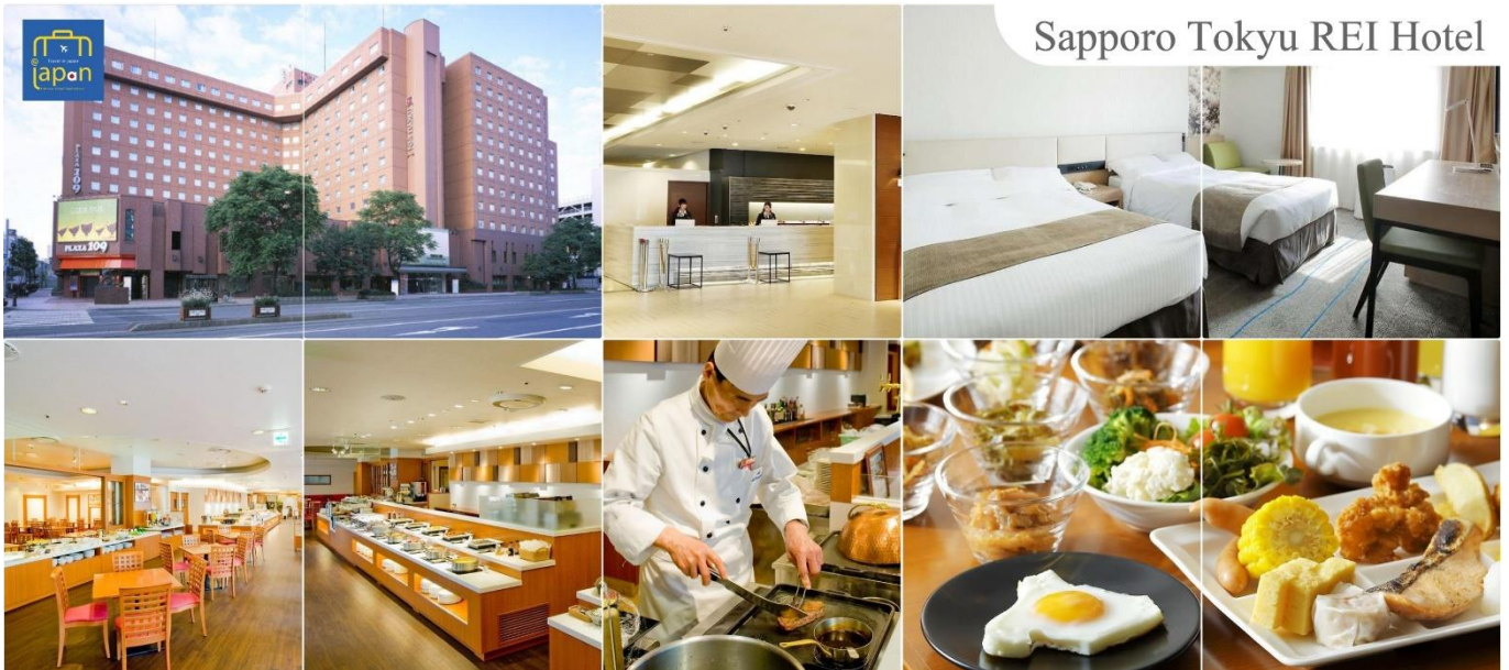
Sapporo Tokyu Rei Hotel

รับประทานอาหารเย็น ณ ภัตตาคาร (7) --- พิเศษ!!! เมนู ชาบู + ชาบู SAPPORO TOKYU REI HOTEL หรือเทียบเท่าระดับเดียวกัน