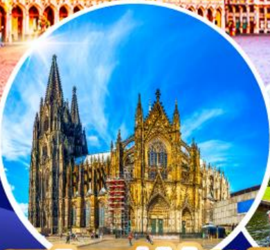
มหาวิหารแห่งโคโลญ หมู่บ้านกีธูร์น