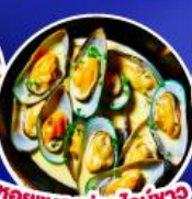
หอยแมลงภู่อินทรีย์