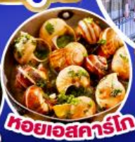
หอยเอสคาร์โท

เดินทาง 17-25 ก.ย.67/11-19, 18-26 ต.ค.67 14-22 พ.ย.67/30 พ.ย.-8 ธ.ค.67 25 ธ.ค.67 - 2 ม.ค.68 (เทศกาลปีใหม่)