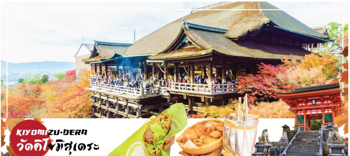
KIYOMIZU-DERA วัดคิโยมิสึเดระ

จากนั้น นำท่านเดินเท้า เพื่อชม ย่านฮิกาชियามา (Higashiyama) ซึ่งเป็นแหล่งรวมสถานที่ท่องเที่ยวที่สำคัญน่าชมของเกียวโตให้บรรยากาศแบบดั้งเดิม แลนด์มาร์คที่โดดเด่นของย่านนี้ เจดีย์ยาซากะ (Yasaka Pagoda) ซึ่งเป็นเจดีย์ 5 ชั้น สูง 46 เมตรที่สามารถมองเห็นได้เกือบจากทุกมุมของย่านนี้ แลนด์มาร์คสวยๆ อีกแห่งที่พลาดการถ่ายรูปไม่ได้ คือ เนินนินเนซากะ (Ninenzaka) และ เนินซันเนซากะ (Sannenzaka) ซึ่งเป็นเนินบันไดที่ปูด้วยแผ่นหินตั้งอยู่ท่ามกลางบ้านไม้