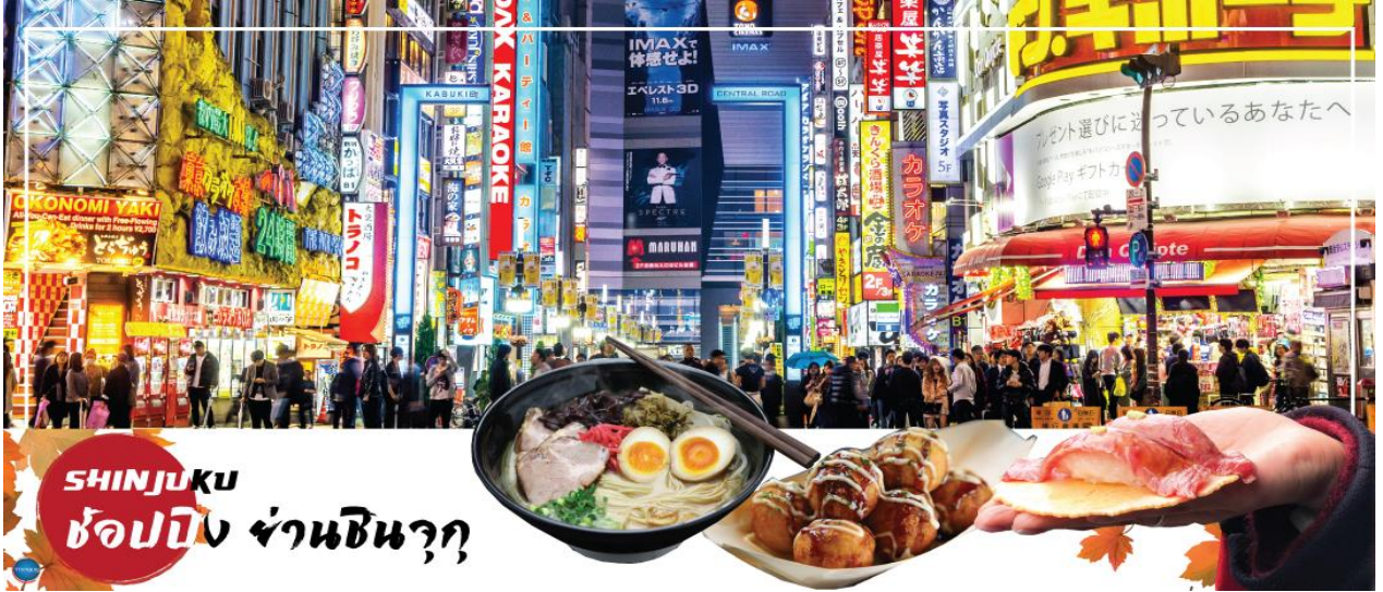
SHINJUKU ช้อปปิ้ง ย่านชินจูกุ

จากนั้นนำท่านช้อปปิ้ง ย่านชินจูกุ (Shinjuku) ให้ท่านอิสระและเพลิดเพลินกับการช้อปปิ้งสินค้ามากมายทั้งเครื่องใช้ไฟฟ้า กล้องถ่ายรูปดิจิทัล นาฬิกา เครื่องเล่นเกม หรือสินค้าที่จะเอาใจคุณผู้หญิงด้วย กระเป๋า รองเท้า เสื้อผ้า แบรินด์เนม เสื้อผ้าแฟชั่นสำหรับวัยรุ่น เครื่องสำอางยี่ห้อดังของญี่ปุ่นไม่ว่าจะเป็น KOSE, KANEBO, SK II, SHISEDO และอื่นๆ อีกมากมาย ห้ามพลาด!!! จุดเช็คอินแห่งใหม่ของชาวโซเชียล นั่นก็คือ แมวยักษ์ 3 มิติ ที่โผล่บนจอแอลอีดีมีขนาดมหึมา จอมีความโค้งขนาด 154 ตารางเมตร (1,664 ตารางฟุต) เสียงที่ออกจากลำโพงคุณภาพเกรดดี ละเอียดภาพระดับ 4K ถือเป็นเทคโนโลยีระดับสูง ที่ให้ภาพเสมือนจริงปรากฏเป็นภาพแมวเหมียวเดินเล่นไปมาอยู่เหนือกรุงโตเกียว นอกจากแมวยักษ์แล้ว ท่านยังสามารถรับชมโฆษณาต่างๆ ที่ถูกครีเอทให้เป็นภาพ 3 มิติผ่านจอแอลอีดีนี้ ไม่ว่าจะเป็น แพนด้า, รองเท้าไนกี้, น้องหมา Pompompurin, จานบิน UFO แม้แต่หุ่นยนต์เครื่องดูดฝุ่น ท่านสามารถรับชมและเก็บภาพได้ตามอัธยาศัย ได้เวลาอันสมควรนำท่านเดินทางสู่ เมืองนาริตะ (ใช้เวลาเดินทางประมาณ 1 ชั่วโมง)