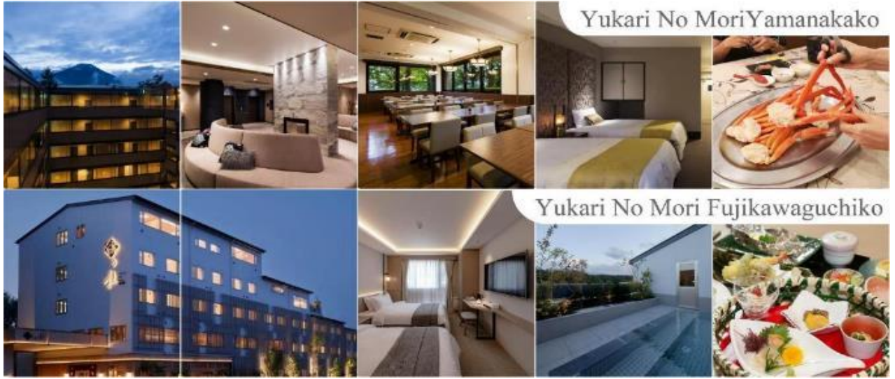
Yukari No Mori Yamanakako

ภาพพรรณสวยงามและช่วยเหาะบบหมุนเวียนเลหดช่น