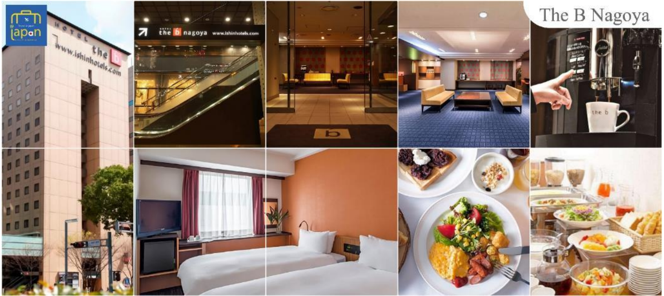
The B Nagoya