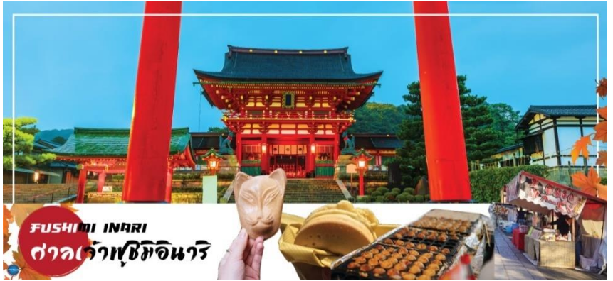
FUSHIMI INARI ศาลเจ้าฟุชิมิอินาริ

ช่วยบันดาลในหลายเรื่องตั้งแต่ พิษพันธุงอกงาม, ค้าขายรุ่งเรือง, คลอดบุตรปลอดภัย, โรคภัยหายป่วย และช่วยในเรื่องการขอให้สอบผ่าน เป็นต้น ศาลเจ้าแห่งนี้ มีชื่อเสียงโด่งดังจาก เสาวโทธิฮิชิแดง เรียงตัวกันจำนวนหลายหมื่นต้นจนเป็นทางเดินได้ทั่วทั้งภูเขาอินาริ ตามตำนานเล่าสู่มาโดยปกติแล้วเทพอินาริจะไม่สื่อสารกับมนุษย์เองโดยตรง แต่จะสื่อสารผ่านบริวารของท่าน นั่นคือ สุนัขจิ้งจอก (คิทสึเนะ 狐) นั่นเอง ทำให้มีรูปปั้นของสุนัขจิ้งจอกตั้งเรียงรายเต็มไปหมด จนคนทั่วไป นิยมเรียก ศาลเจ้าแห่งนี้ว่า ศาลเจ้าจิ้งจอก อิสระให้ท่านขอพรและถ่ายรูปภาพตามอัธยาศัย