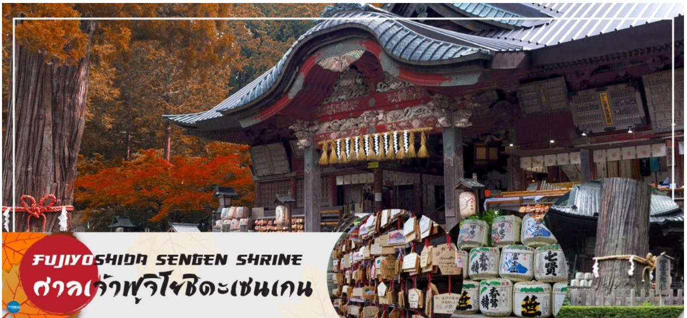
FUJIYOSHIDA SENGEN SHRINE ศาลเจ้าฟูจิโยชิเดะเซนเกน

เมืองยามานาชิ – ศาลเจ้าฟูจิโยชิเดะเซนเกน – พิธีชงชาญี่ปุ่น – กรุงโตเกียว – ชมแมวยักษ์ 3 มิติ พร้อมช้อปปิ้ง ย่านชินจูกุ – เมืองนาริตะ