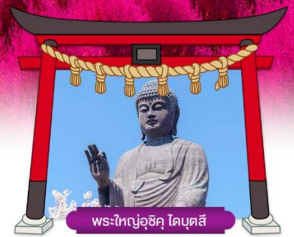
พระใหญ่อุซึคุ ไดบุตสึ