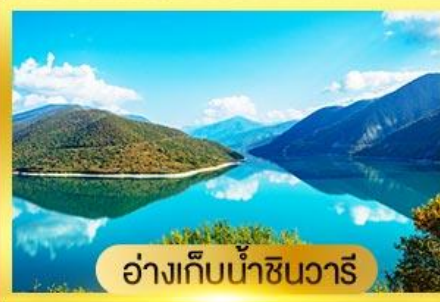
อ่างเก็บน้ำชินวาริ