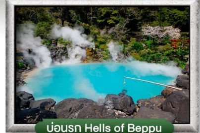
บ่อน้ำ Hells of Beppu