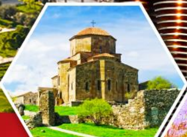
วิหารจอร์เจีย