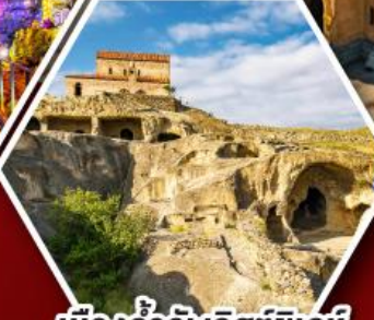
เมืองถ้ำอพิลิสต์ซิคเคห์