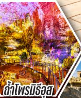
ด้าไฟรมีร์จูล