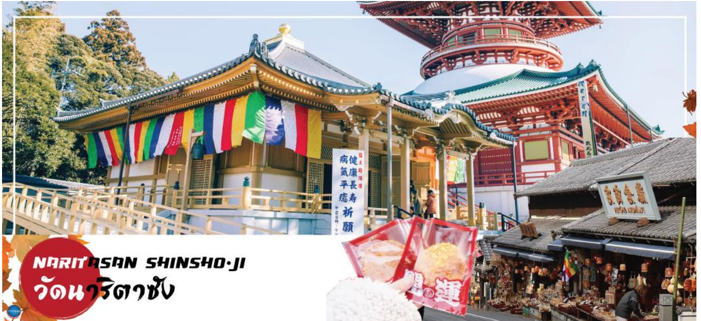
NARITASAN SHINSHO-JI วัดนาริตาชัง

วันที่สอง ท่าอากาศยานนานาชาตินาริตะ - เมืองนาริตะ - วัดนาริตะชิน - ถนนปลาไหล โอโมเตะ ซังโตะ - ย่านโอไดบะ - ห้างไดเวอร์ซิตี - เมืองนาริตะ