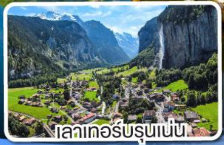
เลาเกอร์บรุนเนน