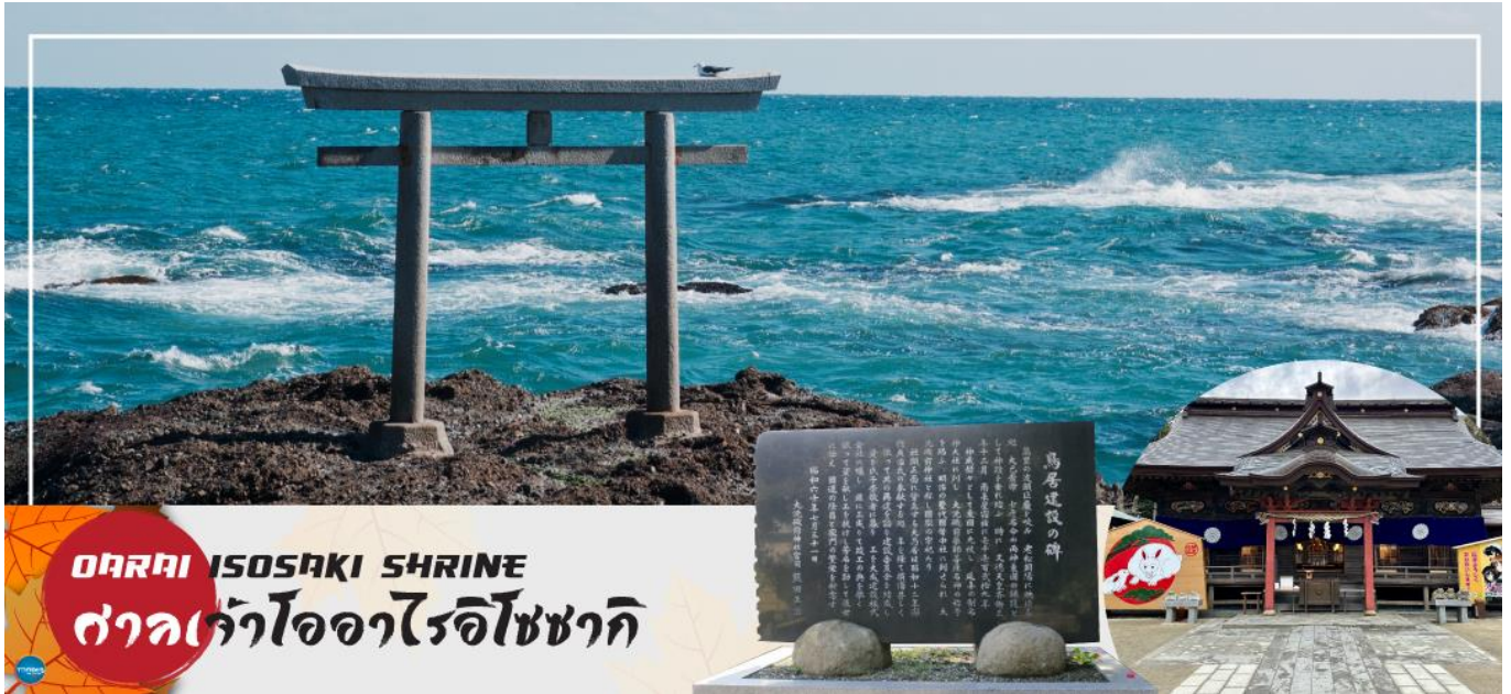
อาราม ISOSAKI SHRINE ศาลเจ้าไอโซไรอิโซซากิ

ตั้งอยู่บนเนินเขาหน้าหน้าท่าเรือท่าเรือแปซิฟิก เป็นหนึ่งในเสาโทริอิขนาดใหญ่ที่มีชื่อเสียงในภูมิภาคคันโต ถูกเลือกให้เป็นทรัพย์สินทางวัฒนธรรมแห่งจังหวัด และได้รับความเชื่อถือมาอย่างยาวนานในฐานะเทพเจ้าผู้ให้ความคุ้มครองการคมนาคมทางทะเล และความสงบสุขภายในครอบครัว นำท่านรับพลังงานบวก ณ เสาโทริอิแห่งคามิอิโซะ (Kamiiso no Torii) โทริอิสีเทาที่หนึ่งสงบ บนโขดหินท่ามกลางฟองคลื่นสีขาวที่สาดกระเซ็น ซึ่งเป็นที่ประดิษฐานของเทพเจ้าโอนามิจิโนะมิโคโตะ และเทพเจ้าสุคะเนฮิโกะเนะโนะมิโคโตะ สร้างขึ้นตั้งแต่ 29 ธันวาคม ค.ศ.856 รวมทั้งยังเป็นจุดถ่ายรูปพระอาทิตย์ขึ้นที่มีชื่อเสียง มีนักท่องเที่ยวมากมายมาเฝ้าคอยเพื่อเก็บภาพช่วงเวลาที่แสงตะวันสาดส่องขึ้นสู่ขอบฟ้า