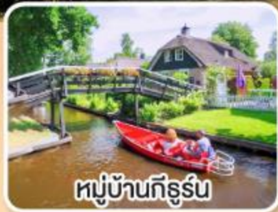
หมู่บ้านกังหัน