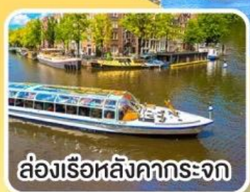
ล่องเรือหลังคากระจก

พิเศษ!! เมนูหอยแมลงภู่อบไวน์ขาว ล่องเรือหมู่บ้านไร้ถนน ที่จอร์น