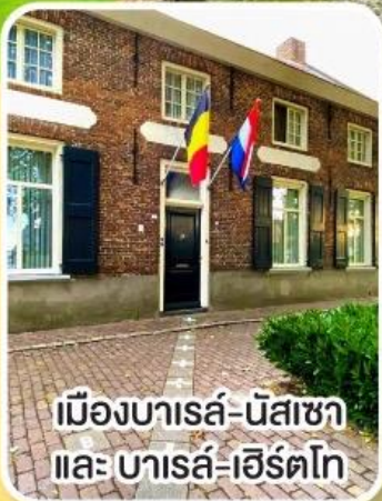
เมืองบารส์-นิสซา และ บารส์-เฮิร์ตโท