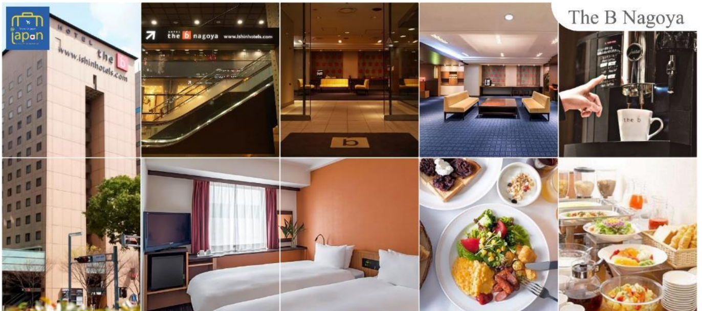
The B Nagoya

เย็น รับประทานอาหารเย็น ณ ภัตตาคาร (5) ที่พัก THE B NAGOYA หรือเทียบเท่าระดับเดียวกัน