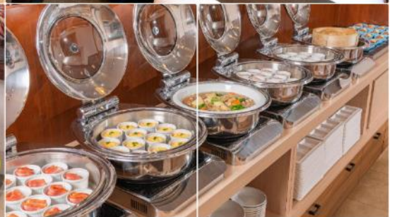
Alpico Plaza Hotel

** ชำระค่าทัวร์ในนามบริษัท ไลออน ทราเวล จำกัด เท่านั้น **