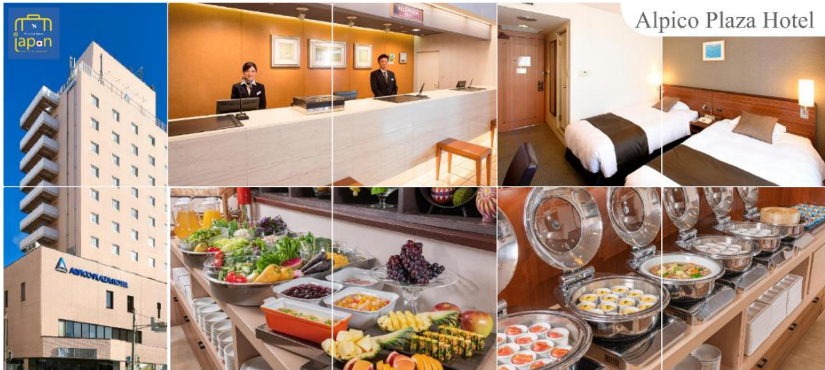
Alpico Plaza Hotel

พักที่ ALPICO PLAZA HOTEL หรือเทียบเท่าระดับเดียวกัน