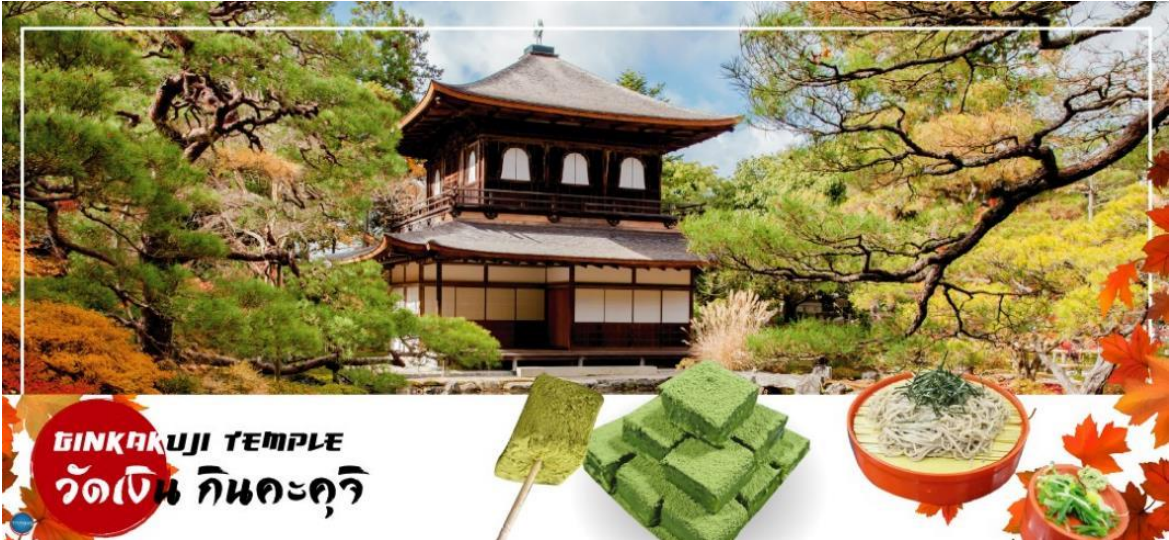
GINKAKUJI TEMPLE วัดเงิน กินคะคุจิ

วันที่สอง ท่าอากาศยานนานาชาติคันไซ โอซาก้า – เมืองเกียวโต – วัดกินคะคุจิ หรือ วัดเงิน – เมืองนาโกย่า – ชมงานประดับไฟฤดูหนาว ณ หมู่บ้านนาบาระ โนะ ซาโตะ