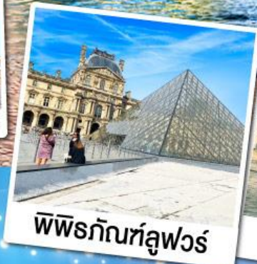
พีพีร์กัทท์ลูฟวร์