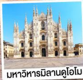
มหาวิหารมิลานดูโอโม

เมนูพิเศษ!! หอยเอสคาโก้ อาหารไทย, ฟองดูชีส