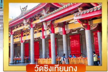
วัดชิงเทียนกง