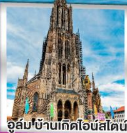
อูร์มบ้านเกิดไอน์สไตน์