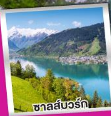
ชาลส์บวร์ก

การ์นต์พิคคังคินบน ยอดเขารีกิ ราชินีแห่งขุนเขาสวิตเซอร์แลนด์