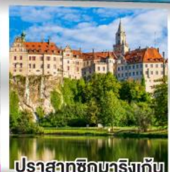
ปราสาทชิกมริงเกิน