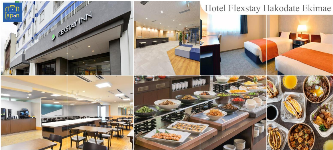
Hotel Flexstay Hakodate Ekimae

FLEX STAY INN HAKODATE EKIMAE หรือเทียบเท่าระดับเดียวกัน