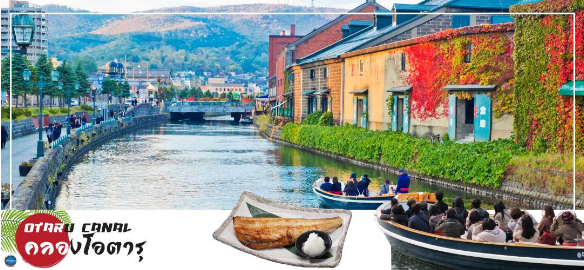
OTARU CANAL คลองโอตารุ

วันที่ทำ เมืองซัปโปโร - ดิวตี้ฟรี - เมืองโอตารุ - คลองโอตารุ - พิพิธภัณฑ์กล่องดนตรี - เมืองซัปโปโร - หมู่บ้านช็อคโกแลต อิชิยะ (ด้านนอก) - ซุปป์ทานุกิโคจิ