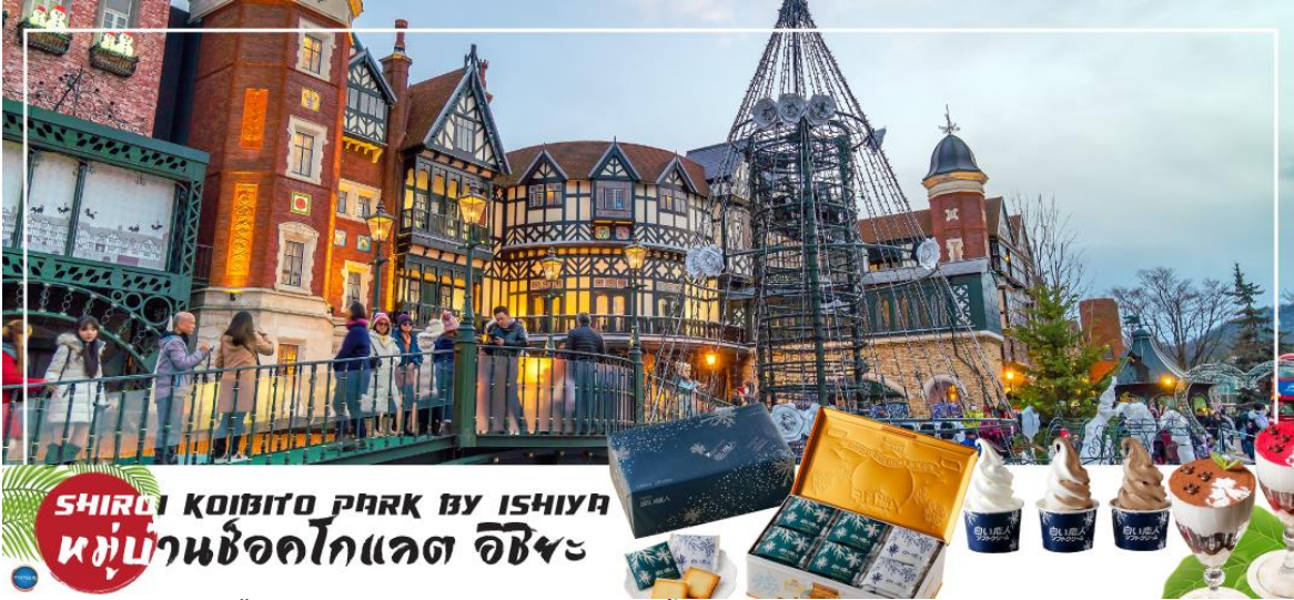
SHIROI KOIBITO PARK BY ISHIYAMA หมู่บ้านช็อคโกแลต อิชียะ

ด้วยสวนดอกไม้ จึงทำให้บรรยากาศของหมู่บ้านช็อคโกแลตที่นี่ดูคลาสสิกและน่ารักไปอีกแบบช็อคโกแลตที่ขึ้นชื่อที่สุดของที่นี่คือ Shiroi Koibito ซึ่งมีความหมายว่าช็อคโกแลตชาวแต่คนรัก ท่านสามารถเลือกซื้อกลับไปให้คนที่ท่านรักทานหรือว่าซื้อเป็นของขวัญฝากติดไม้ติดมือกลับบ้านก็ได้ นอกจากนี้ท่านจะได้เลือกซื้อช็อคโกแลตที่หาซื้อที่ไหนไม่ได้ และ ท่านก็ยังจะได้ชมประวัติความเป็นมาของโรงงาน และการผลิตช็อคโกแลตอีกด้วย