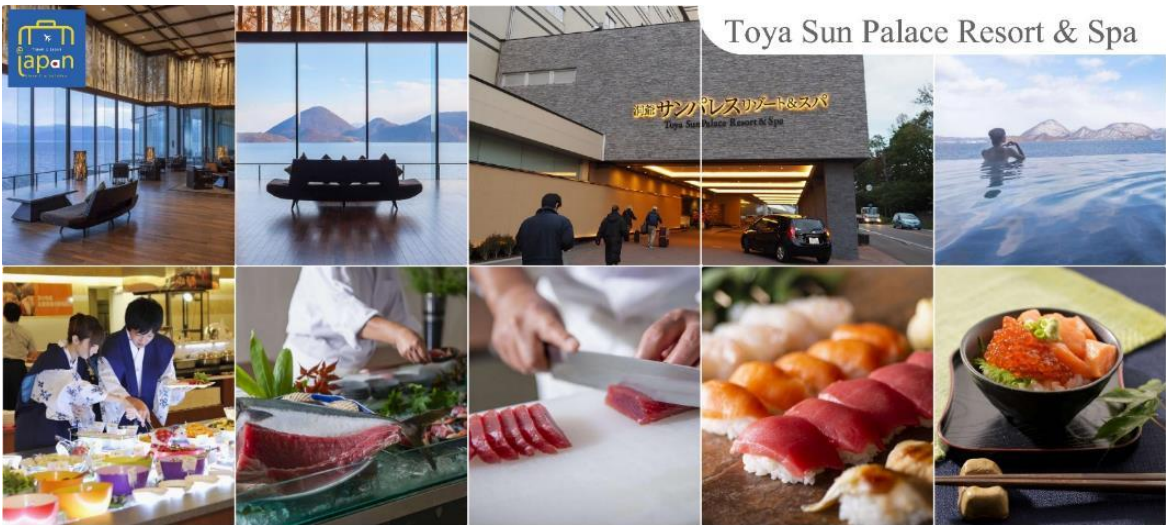
Toya Sun Palace Resort & Spa

TOYA SUN PALACE RESORT & SPA หรือเทียบเท่าระดับเดียวกัน