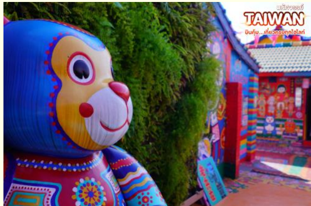
TAIWAN ดินถิ่น...ถิ่นของรักโลก

ไต้หวันที่ไม่มีการติดต่อกับทะเล(ใช้เวลาเดินทางประมาณ 30 นาที)