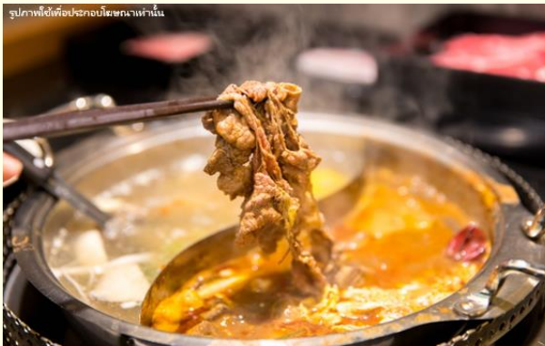
รูปภาพใช้เพื่อประกอบโฆษณาเท่านั้น

กลางวัน ๑๑ บริการอาหารกลางวัน ณ ร้านอาหาร พิเศษ!!ชาบูสไตล์ไต้หวัน