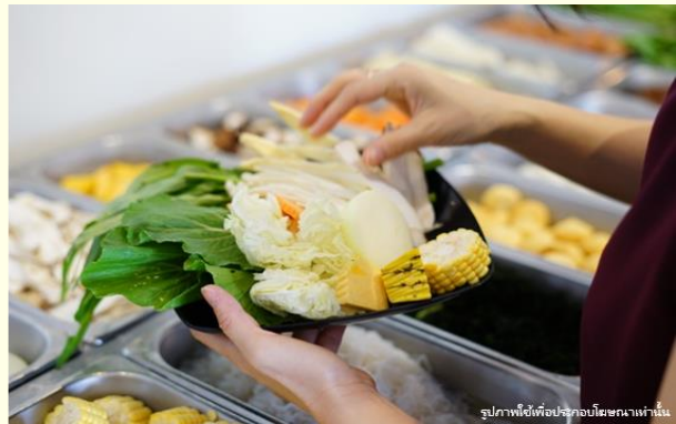
รูปภาพใช้เพื่อประกอบโฆษณาเท่านั้น