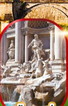
น้ำพุเทรวี่