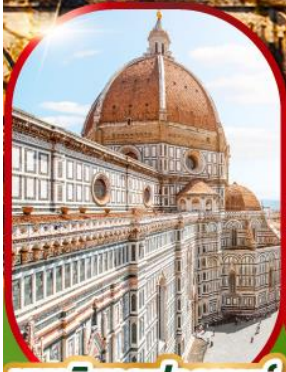
มหาวิหารฟลอเรนซ์