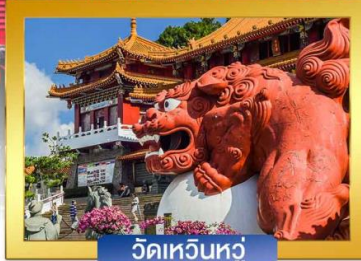
วัดเหวินหัว