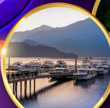
ล่องเรือทะเลสาบสุริยจันทร์

ลิ้มรสอร่อยกับ Michelin Star เสียดายหลงไปพลาดรสอร่อยเด็ด