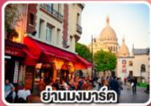
ย่านมงมาร์ต