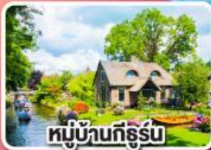
หมู่บ้านที่รูร์ม

พักปารีสและอัมสเตอร์ดัม อย่างละ 2 คืน ไม่ต้องเปลี่ยนโรงแรมบ่อย