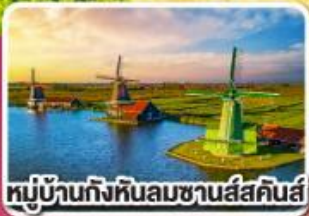
หมู่บ้านกังหันลมซานส์คินส์