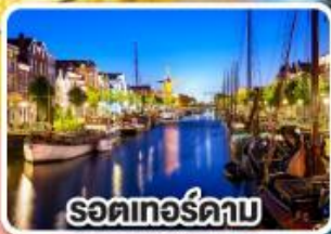
รอดเทอร์ดาัม