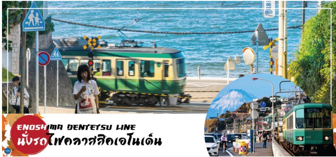
ENOSHIMA DENTETSU LINE นั่งรถไฟคลาสสิกเอนโด้

จากนั้นนำท่านสักการะ หลวงพ่อดาโบตสึ (Kamakura Daibutsu) (ใช้เวลาเดินทางประมาณ 15 นาที) ภายในวัดโคโดคุอิน โดยประดิษฐานตระหง่านเป็นสัญลักษณ์ของเมืองคามาคูระ ด้วยความสูง 13.35 เมตร โดยเป็นพระพุทธรูปปางนั่งสมาธิที่สูงที่สุดเป็นอันดับสองของประเทศญี่ปุ่น (องค์ที่สูงที่สุด อยู่ที่วัดโทไดจิ เมืองนารา) องค์ไดบุตสึนี้สร้างขึ้นในปี ค.ศ.1252 ทำด้วยบรอนซ์ทั้งองค์ เคยตั้งอยู่ในอารามไมโจกลางของวัด ต่อมาปลายศตวรรษที่ 15 เกิดแผ่นดินไหวที่ส่งผลให้เกิดคลื่นสึนามิในแถบนี้ จนทำลายตัวอารามทั้งหมด เหลือไว้เพียงองค์ไดบุตสึตั้งเด่นเป็นสง่าตระหง่านทุกวันนี้ นำท่านเดินชมบรรยากาศรอบข้างก่อนที่จะเดินถึง สถานีฮาเสะ (ใช้เวลาเดินเท้าไม่เกิน 15 นาที) เพื่อนำท่าน นั่งรถไฟคลาสสิกเอนโด้ สู่ สถานีเอนชิมะ (ใช้นั่งรถไฟประมาณ 30 นาที) ( Enoshima Dentetsu Line ) คือรถไฟสายยอดนิยมตั้งแต่ในหมู่คนท้องถิ่นไปจนถึงนักท่องเที่ยว มีชื่อที่เรียกกันทั่วไปว่า "เอนโด้ (Enoden)" เป็นรถไฟท้องถิ่นที่ช่วยให้การเดินทางท่องเที่ยวคามาคูระ เป็นเรื่องแสนสะดวกสบาย จากภายในขบวนรถมองออกไปจะเห็นทิวทัศน์ข้างทางและวิวทะเลที่สวยงาม พร้อมบางจุดยังเห็นวิวฟูจิได้สวยงามอีกด้วย