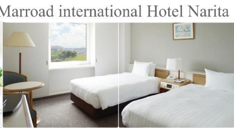
Marroad international Hotel Narita