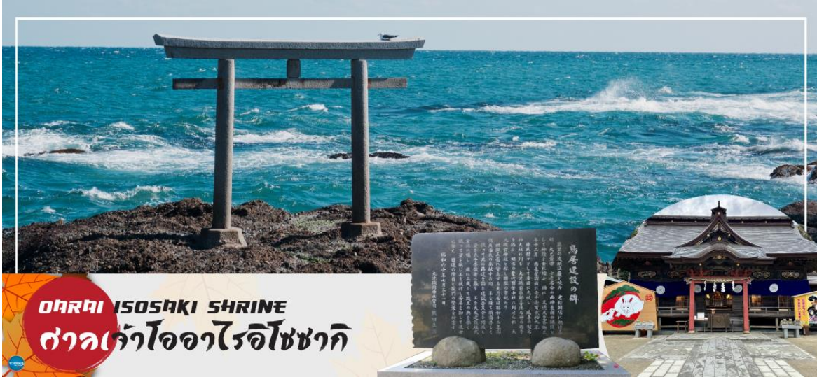
ศาลเจ้าอิโงะไรโซซากิ ISOSAKI SHRINE

พระอาทิตย์ขึ้นที่มีชื่อเสียง มีนักท่องเที่ยวมากมายมาเฝ้าคอยเพื่อเก็บภาพช่วงเวลาที่สวยงามที่แสงตะวันสาดส่องขึ้นสู่ขอบฟ้า