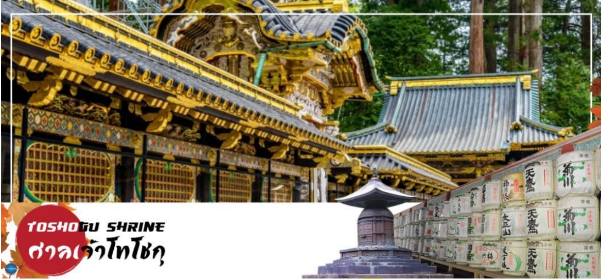
TOSHOGU SHRINE ศาลเจ้าโทโชกุ

วันที่สาม เมืองนิกโกะ - ผ่านชม สะพานชินเคียว - ศาลเจ้าโทโชกุ - ศาลเจ้าฟูตาระ - จังหวัดไซตามะ - ย่านเมืองเก่าคาวะโกเอะ - ตรอกลูกกวาด - เมืองยามานาชิ - ออนเซ็น + ชาบูยักษ์