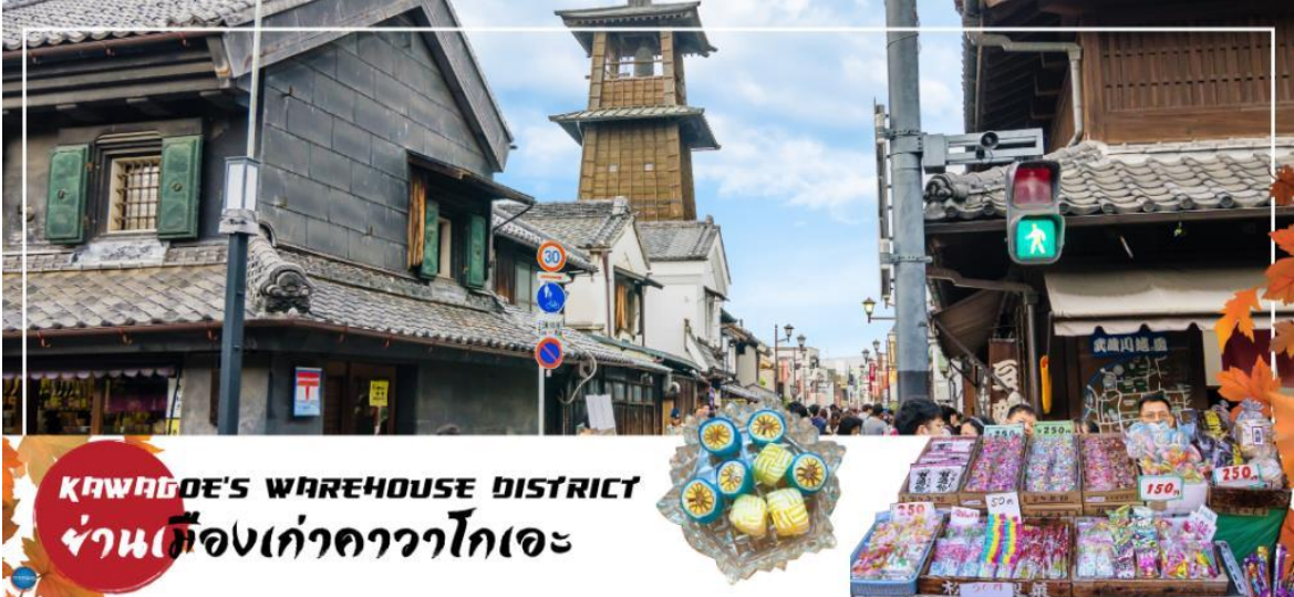
KAWAGOE'S WAREHOUSE DISTRICT ย่านเมืองเก่าคาวาโกเอะ

เที่ยง รับประทานอาหารกลางวัน ณ ภัตตาคาร (3)