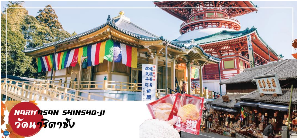
NARITASAN SHINSHO-JI วัดนาริตาซัง

วันที่นำ เมืองนาริตะ – วัดนาริตะชิน – ถนนปลาไหล โอโมเตะซังโตะ – กรุงโตเกียว – ตลาดปลาซึกิจิ – ชมมวยยักษ์3มิติ พร้อมช้อปปิ้งย่านชินจูกุ – เมืองนาริตะ