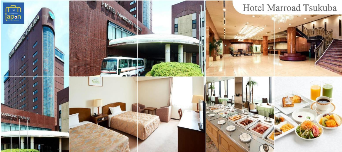
Hotel Marroad Tsukuba

ได้เวลาอันสมควรนำท่านเดินทางสู่ เมืองสีคบุะ (Tsukuba) (ใช้เวลาเดินทางประมาณ 1 ชั่วโมง) รับประทานอาหารเย็น ณ ภัตตาคาร (1) HOTEL MARROAD, TSUKUBA หรือระดับเดียวกัน