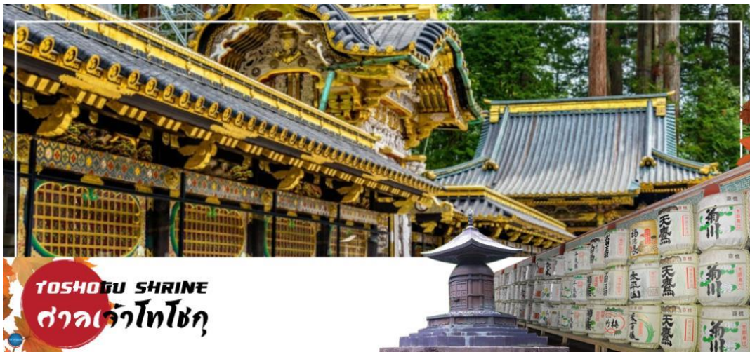
TOSHOGU SHRINE ศาลเจ้าโทโฮกุ

วันที่สาม เมืองนิกโกะ - ผ่านชม สะพานชินเคียว - ศาลเจ้าโทโฮกุ - ศาลเจ้าฟูตาระ - จังหวัดไซตามะ - ย่านเมืองเก่าคาวะโกเอะ - ตรอกลูกกวาด - เมืองยามานาชิ - ออนเซ็น + ชาบูยักษ์