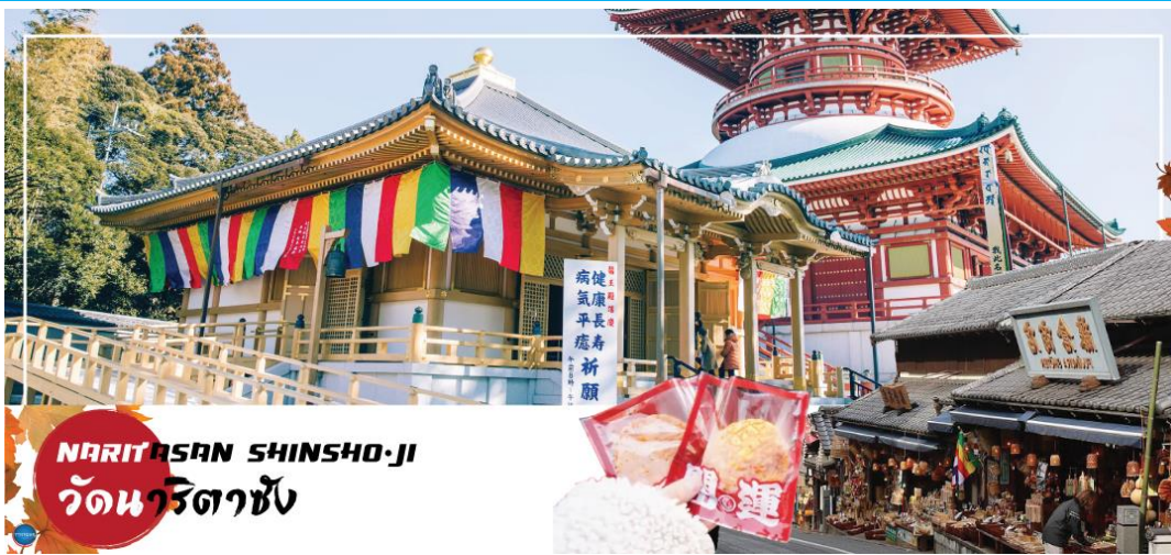
NARITASAN SHINSHO-JI วัดนาริตาชัง

วันที่ห้า เมืองนาริตะ – วัดนาริตะชิน – ถนนปลาไหล โอโมเตะซังโอะ – กรุงโตเกียว – ตลาดปลาซึกิจิ – ชมมวยยักษ์3มิติ พร้อมช้อปปิ้งย่านชินจูกุ – เมืองนาริตะ