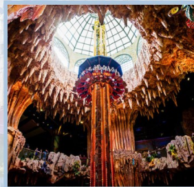
สวนสนุก Fantasy Park

นำท่านเดินทางสู่ เขานานาฮิลล์ (BA NA HILL) อยู่ในจังหวัดตานัง ห่างจากตัวเมืองประมาณ 25 กิโลเมตร มีความสูงจากระดับน้ำทะเล 1,487 เมตร ภูเขาแห่งนี้ถูกเนรมิตขึ้นใหม่ให้มั่งคั่ง โรงแรมที่พัก วัดวาอาราม หมู่บ้านฝรั่งเศส สวนสนุก สวนดอกไม้ พร้อมกับสะพานริมเขาสุดอลังการแห่งใหม่ เป็นสถานที่ตากอากาศที่ดีที่สุดของเวียดนามกลาง ถูกค้นพบในสมัยที่ฝรั่งเศสเข้ามาปกครองเวียดนาม ได้สร้าง “แพนดาศี ปาร์ค” สวนสนุกในร่มและกลางแจ้งขนาดใหญ่ สร้างให้เป็นเหมือนเมืองแห่งเทพนิยายที่สวยงาม ตั้งอยู่ท่ามกลางสายหมอกบนยอดเขาแห่งนี้