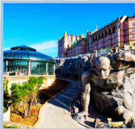
โซน Eclipse Square