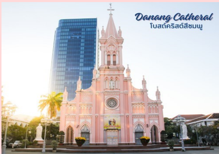
Danang Cathedral โบสถ์คริสต์สีชมพู

นำท่านถ่ายรูป โบสถ์คริสต์ดานัง หรือโบสถ์คริสต์สีชมพู (Danang Cathedral) สร้างขึ้นสมัยเวียดนามตกเป็นอาณานิคมของฝรั่งเศส สถาปัตยกรรมสไตล์โกธิก ยตกแต่งด้วยความประณีตสวยงาม ตัวโบสถ์เป็นสีชมพูทั้งหลัง ตัดขอบด้วยสีขาว เป็นอีกหนึ่งสถานที่ที่ไม่ควรต้องพลาดเมื่อมาเยือนเมืองดานัง จากนั้น อิสระช้อปปิ้ง ตลาดฮาน อิสระเลือกซื้อสินค้าหลากหลายชนิด เช่น ผ้า เหล้า บุหรี่ และของกินต่างๆ เป็นตลาดสดและขายสินค้าพื้นเมืองของเมืองดานัง