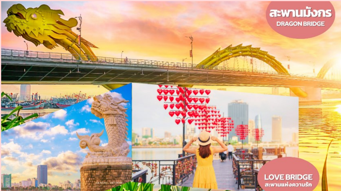
สะพานมังกร DRAGON BRIDGE

นำท่านแวะ ร้านผ้าไหม อิสระในการเลือกซื้อผ้าไหมสไตล์เวียดนาม เช่น ชุดเครื่องนอน เสื้อผ้า ผ้าพันคอ เป็นต้น จากนั้นนำท่านชม สะพานแห่งความรัก (LOVE BRIDGE) ที่คู่รักนิยมพากันมาถ่ายรูป เขียนชื่อคล้องกุญแจบนสะพานแห่งนี้ เป็นอีกจุดที่นิยมสำหรับวัยรุ่นและนักท่องเที่ยว สะพานมังกร (DRAGON BRIDGE) สะพานมังกรไฟ สัญลักษณ์ความสำเร็จแห่งใหม่ของเวียดนาม มีความยาว 666 เมตร ความกว้างเท่าถนน 6 เลนส์ เชื่อมต่อสองฟากฝั่งของแม่น้ำฮานประเทศเวียดนาม สะพานมังกรถูกสร้างขึ้นเพื่อเป็นแหล่งท่องเที่ยว เป็นสัญลักษณ์ของการฟื้นคืนประเทศฟื้นฟูเศรษฐกิจของประเทศโดยได้เปิดใช้งานตั้งแต่ปี 2013 ด้วยสถาปัตยกรรมที่บวกกับเทคโนโลยีสมัยใหม่ที่ได้รับแรงบันดาลใจจากตำนานของเวียดนาม