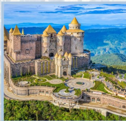
ปราสาทจันตรา