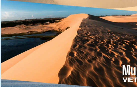
Mũi Ne VIETNAM