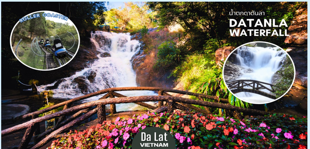
น้ำตกดาตันลา DATANLA WATERFALL

นำท่านสัมผัสประสบการณ์สุดตื่นเต้นโดยการ นั่งรถราง (Roller Coaster) ผ่านผืนป่าอันร่มรื่นเขียวชอุ่มลงสู่หุบเขา เบื้องล่าง เพื่อชมและสัมผัสกับความสวยงามของ น้ำตกดาตันลา (Datanla Waterfall) อยู่ห่างจากตัวเมืองดาลัดไปทางทิศใต้ประมาณ 5 กิโลเมตร เป็นน้ำตกไม่ใหญ่มากแต่มีความสวยงาม น้ำตกแห่งนี้จะเป็นน้ำตกที่มีนักท่องเที่ยวมาเยือนมากที่สุดและไม่ควรพลาดในการมาเที่ยวชม (ราคาทัวร์รวมบริการนั่งรถรางโรลเลอร์โคสเตอร์แล้ว)