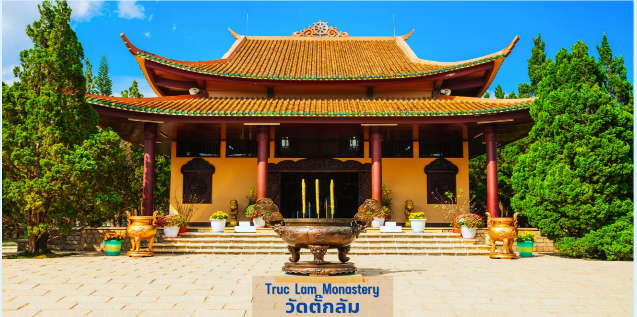
Truc Lam Monastery วัดตึกถัม

นำท่าน นั่งกระเช้า เพื่อเข้าไปเที่ยวชม วัดตึกถัม (Truc Lam Monastery) เป็นวัดพุทธในนิกายเซน แบบญี่ปุ่น ตั้งอยู่บนเทือกเขาเฟื่องฮว่าง ภายในบริเวณวัดนอกจากจะมีสิ่งก่อสร้างที่สวยงาม สะอาด เป็นระเบียบเรียบร้อย แล้ว ยังมีการจัดทัศนียภาพโดยรอบด้วยสวนดอกไม้ที่ผลิดอกบานสะพรั่ง นับได้ว่าเป็นวิหารซึ่งเป็นที่นิยมและงดงามที่สุดในดาลัด