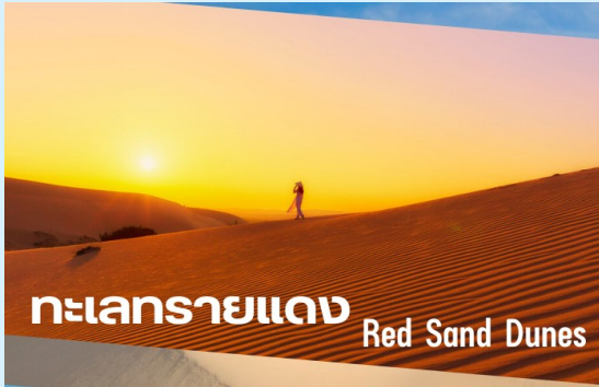
ทะเลทรายแดง Red Sand Dunes

** ชำระค่าทัวร์ในนามบริษัท ไลออน ทราเวล จำกัด เท่านั้น **