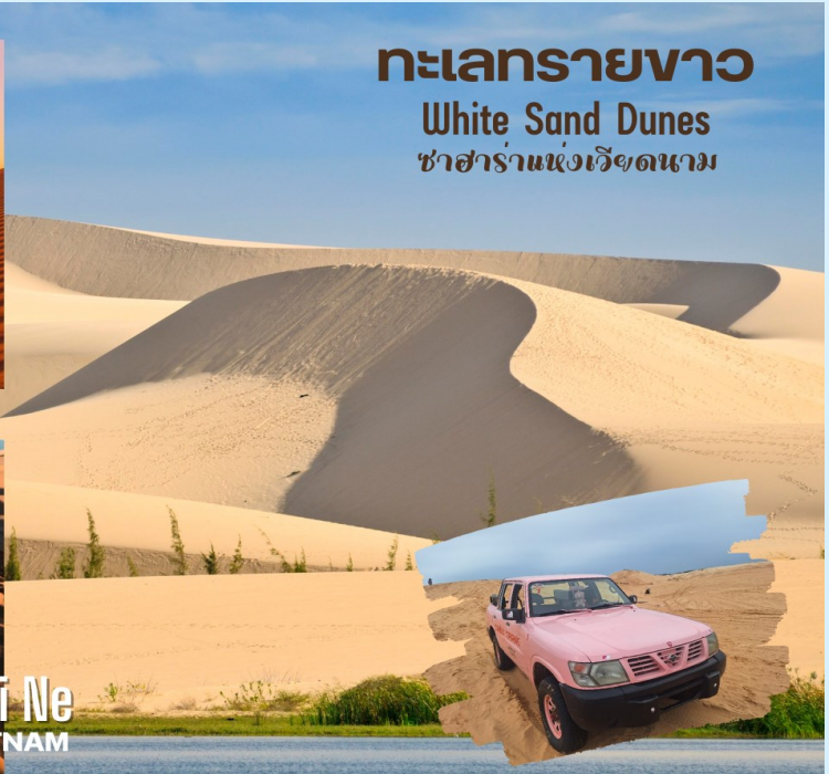
ทะเลทรายขาว