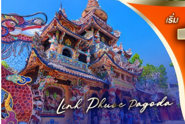
Link Phuc Pagoda