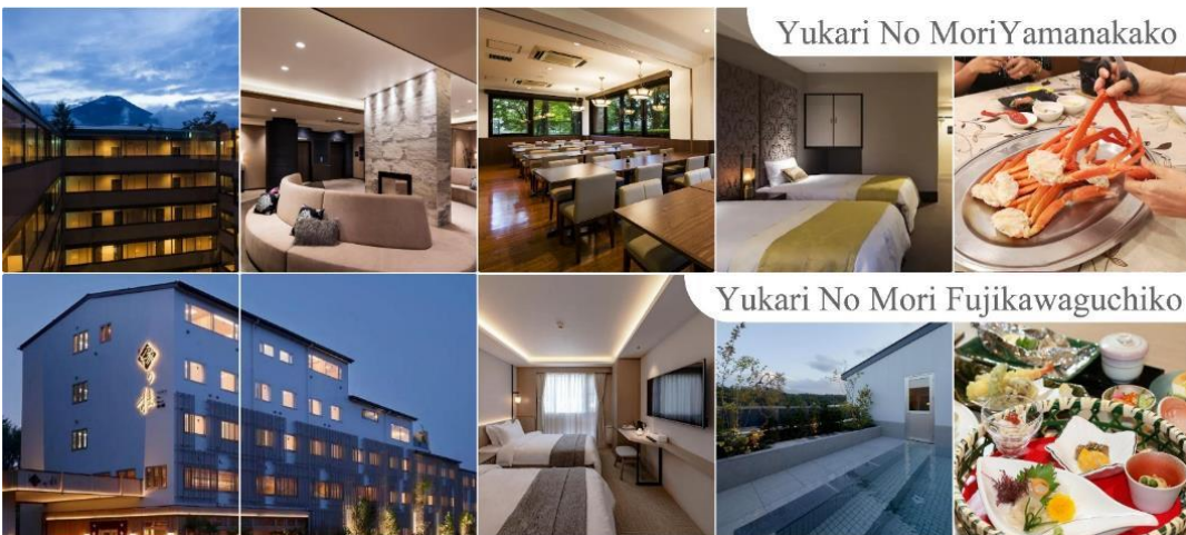
Yukari No Mori Yamanakako

YUKARI NO MORI, YAMANAKAKO หรือระดับเดียวกัน หลังอาหารให้ท่านได้ผ่อนคลายกับการแช่น้ำแร่ธรรมชาติ เชื่อว่าถ้าได้แช่น้ำแร่แล้ว จะทำให้ผิวพรรณสวยงามและช่วยให้ระบบหมุนเวียนโลหิตดีขึ้น