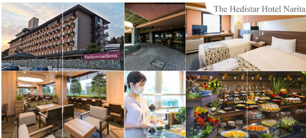
The Hedistar Hotel Narita

พักที่ THE HEDISTAR HOTEL NARITA หรือระดับเดียวกัน