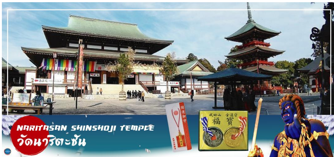
NARITASAN SHINSHOJI TEMPLE วัดนาริตะชิน

วันที่สี่ เมืองนาริตะ - วัดนาริตะชิน - ถนนปลาไหล โอมโตะซังโตะ - ย่านโตะมะ - ห้างไดเวอร์ซิตี - ท่าอากาศยานนานาชาตินาริตะ