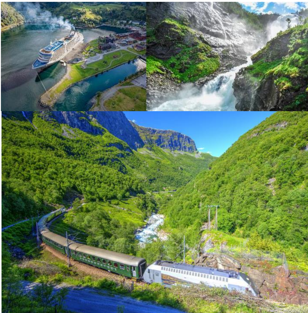
GO3ARN-EK007 นัดออกเดินทาง เรือสำราญ Sea View S-N-D 8D5N-EK Oct, Nov-Dec2024, NY2025

รับประทานอาหารกลางวัน ณ ภัตตาคารพื้นเมือง