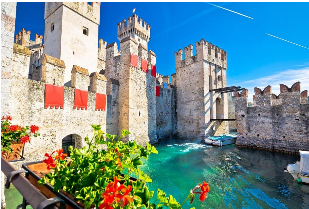
กลางวัน อิสระอาหารกลางวันตามอัธยาศัย

นำท่านเดินทางสู่ เมืองซิร์มิโอเน่ (Sirmione) เมืองแห่งบ่อมปราการโบราณ เก้าแก่อายุนับ 2000 ปี ด้วยลักษณะภูมิประเทศที่เป็นแหลมยื่นเข้าไปในทะเลสาบการ์ดา (Lake Garda) นำท่านถ่ายภาพด้านหน้าปราสาทเก่าแก่ของเมือง (The Scallger of Sirmione) สร้างในปี 1277 ซึ่งเมืองนี้เคยอยู่ในการปกครองของตระกูล SCALIGER จากนั้นเดินเล่นชมเมืองเก่าซิมไอศรีมเจลาโต้ที่มีชื่อเสียงของอิตาลี หลากหลายร้านและของที่ระลึกอื่นๆ อิสระให้ท่านชมความสวยงามของวิวทิวทัศน์ของทะเลสาบการ์ดา ซึ่งเป็นทะเลสาบน้ำจืดที่เกิดจากน้ำแข็งละลายจากเทือกเขาแอลป์