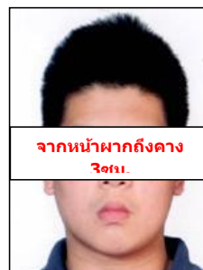
จากหน้าผากถึงคาง 3cm.

** ชำระค่าทิวไรในนามบริษัท ไลออน ทราเวล จำกัด เท่านั้น **