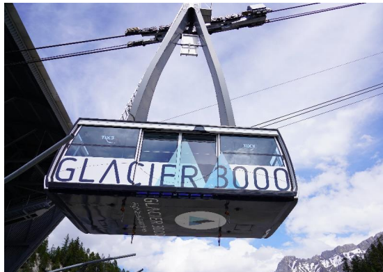
Highlight! กระเช้าไฟฟ้าขนาดยักษ์ที่ผู้โดยสารได้ถึง 125 คน

นำท่านเดินทางสู่ หมู่บ้านโคล เดอ ปียง (Col De Pillon) เป็นที่ตั้งของสถานี นำท่านนั่งกระเช้าลอยฟ้า สู่ ยอดเขากลาเซียร์ 3000 (Glacier 3000) มีความสูงเกือบ 3,000 เมตรเหนือระดับน้ำทะเล ชมทิวทัศน์อันงดงามของท้องฟ้าและเทือกเขามากมายแบบพาโนรามา และให้ท่านท้าทายความสูงเดินบน "The Peak Walk by Tissot" สะพานแขวนที่มีความยาว 107 เมตรข้ามหน้าผาที่ระดับความสูง 3,000 เมตร ทำให้เป็นสะพานแขวนที่สูงที่สุดในโลก