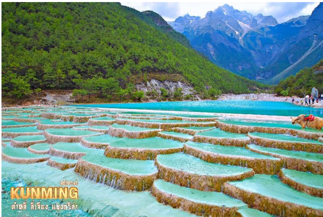
นี่คือเมือง KUNMING ต้าเซี๋ ลี้เจียง แห่งกรีนลัน

เก็บความประทับใจอย่างเต็มอิ่ม และชมความงดงามผืนน้ำสีเทอควยซ์ของ ทะเลสาบไป๋สือเหอ ทะเลสาบที่อยู่อีกด้านหนึ่งของภูเขาหิมะมังกรหยก น้ำในทะเลสาบแห่งนี้ไหลลงมาจากการละลายของหิมะบนภูเขาหิมะมังกรหยก สามารถดื่มชมความสวยของทะเลสาบได้ตลอดระยะทาง 3 กิโลเมตร หรือจะเลือกนั่งรถรับส่งได้ตามสะดวกไปยังจุดท่องเที่ยวยอดนิยม (รวมค่ารถแบคเตอร์) ระหว่างทางเดินเลียบทะเลสาบจะพบเห็นคู่รักชาวจีนที่นิยมมาถ่ายพีริเวดดิ้ง และมีเจ้าหน้าที่คอยพาจามรีมาบริการให้นักท่องเที่ยวได้ถ่ายรูป (ไม่รวมค่าบริการถ่ายรูป ราคาประมาณ 50 หยวน)