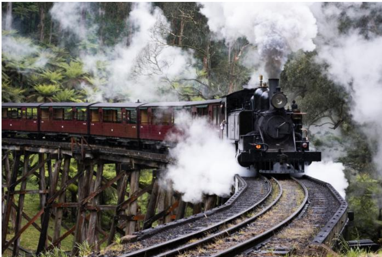
23.35 น. ออกเดินทางกลับสู่กรุงเทพฯด้วยเที่ยวบิน SQ218

และยังมีอาคารบ้านเก่าสร้างตั้งแต่สมัยศตวรรษที่ 19 ด้วยบรรยากาศแบบชาวจีนและชาวเอเชีย หรือจะช้อปปิ้งห้างสรรพสินค้าชื่อดัง อาทิ ห้างเดวิด โจน์ ห้างมายเออร์ ในย่านถนน Swanston Street และ Elizabeth Street ที่เต็มไปด้วยร้านเสื้อผ้าแฟชั่นหลากหลายสำหรับบุรุษและสตรี