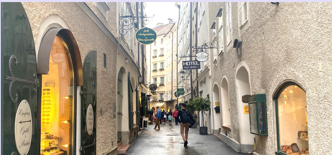
VVIE97AI-18 East Europe ปีใหม่ ใจป่า ออสเตรีย ฮังการี เช็ก สโลวาเกีย 9D7N