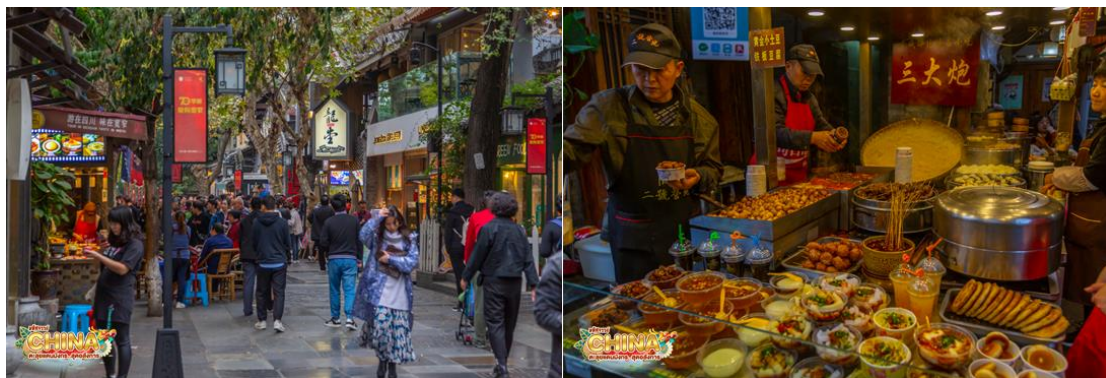
** อิสระอาหารเย็นตามอัธยาศัย เพื่อความสะดวกในการช้อปปิ้ง **

กลางวัน ๑๑ บริการอาหารกลางวัน ณ ภัตตาคาร จากนั้น ชมซันบรยากาศ ถนนโบราณจินหนี่ เป็นถนนคนเดินอยู่ติดกับศาลเจ้าสามก๊ก หรือศาลเจ้าขงเบ้ง (จุดกัณฑ์เสียง) มีสินค้าให้ซ้อปิ้งได้ทั้งของรับประทานและของฝากของที่ระลึก หากกำลังมองหาของที่ระลึกที่มีสัญลักษณ์ของเมืองเฉิงตู อาทิ หมี่แพนด้า ตุ๊กตาเปลี่ยนหน้ากาก ชา ผ้าไหม และยาสมุนไพรต่างๆ ก็สามารถมาเก็บครบรวดเดียวได้ที่นี่ และเดินเที่ยว ถนนชอยกว้างชอยแคบ เป็นถนนที่แสดงถึงวิถีชีวิตของคนจีนเฉิงตูในสมัยโบราณ ผสมความเป็นทันสมัยเข้าไปอย่างลงตัว ถนนคนเดินมี 3 ซอย แต่ละซอยมีความยาวประมาณ 400 เมตร มีร้านค้าเล็กๆ ตั้งเรียงรายอยู่ในแต่ละซอยและตรอกให้เดินช้อปปิ้งเพลิน ทั้งร้านหนังสือ ร้านชา-กาแฟ บาร์ เสื้อผ้า ไปจนถึงร้านอาหารนานาชาติ