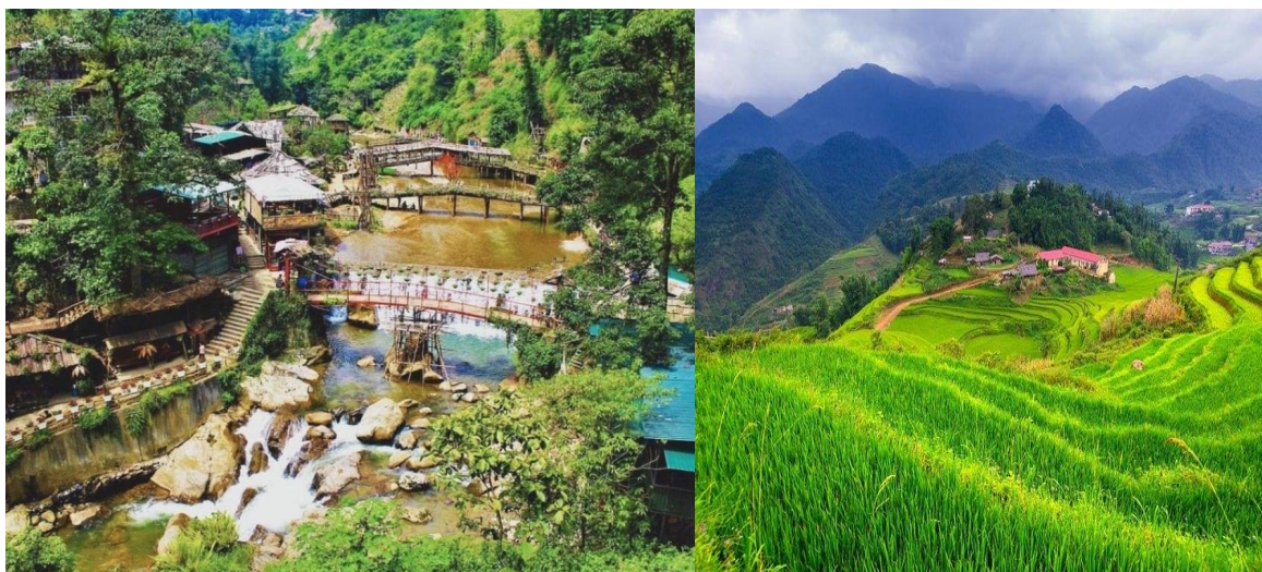
GO1CNXHAN-FD001 ไปแ่วกันเต๊ะ บินตรง..เชียงใหม่ เวียดนามเหนือ ฮานอย ซาปา ฟานซีปัน 4 วัน 3 คืน (FD)

หลังจากนั้นนำท่านเดินทางสู่ หมู่บ้านก๊าทก๊าท (CAT CAT VILLAGE) เป็นหมู่บ้านของชาวเขาเผ่าม้ง อยู่ห่างจากเมืองซาปาประมาณ 2-3 กิโลเมตร เราสามารถเข้าไปเยี่ยมชมวิถีชีวิตชาวเขา บ้านเรือน และการแต่งกาย ที่ยังคงอนุรักษ์เอาไว้เป็นอย่างดี การมาที่หมู่บ้านแห่งนี้ไม่เพียงแต่ได้พบกับวิถีชีวิตชาวเขาเท่านั้น กิจกรรมที่ต้องไม่พลาดคือการเดินไปชมนาขั้นบันได และวิวสวยๆ ในมุมสูงของภูเขา ที่เป็นไฮไลท์ของการมาเที่ยวซาปา