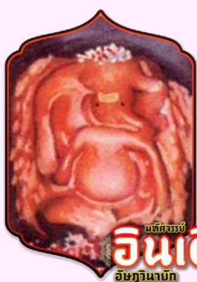
มณฑลธรรม อินเดีย อิชฏวานายก