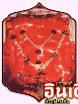
มณฑลธรรม อินเดีย อิชฏวานายก

นำท่านเดินทางสักการะแห่งที่ 7 วัดศรีคีรีจัตมา (Sri Girijatmaj) ประดิษฐานอยู่ที่ เลนยาตริ ตั้งอยู่ในถ้ำบนภูเขาริมแม่น้ำกุกติ เมืองเลนยาตริ (Lenyadri) ซึ่งครั้งหนึ่งถ้ำที่ภูเขาแห่งนี้ ได้ขุดเจาะเพื่อเป็นวัดในพระพุทธศาสนา หลังจากพระพุทธศาสนาเริ่มเสื่อม ศาสนาฮินดูก็รุ่งเรือง และภายในถ้ำแห่งนี้ก็เกิดปาฏิหาริย์ มีพระพิฆเนศเกิดขึ้นมาทำให้ชาวฮินดูขึ้นมาถวายตราชามหาเทพ จึงทำให้ถ้ำแห่งนี้กลายเป็นถ้ำของพระพิฆเนศ การสักการะองค์พระพิฆเนศ จะต้องขึ้นบันได 283 ขั้น เทเวศานานแห่งนี้เล่าว่า พระแม่ปารวตี (พระอูมาเทวี) ต้องการโอรสมากจึงได้ทำพิธีป็นยากพรต