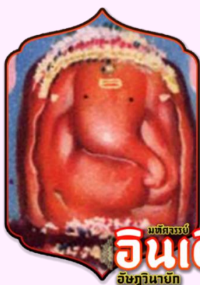
มณฑลธรรม อินเดีย อิชฏวานายก

เชื่อว่าผู้ที่มาสักการะองค์ศรีวิฆเนศวรก่อนทำการใดๆ จะทำการนั้นได้สำเร็จราบรื่น ไร้อุปสรรค