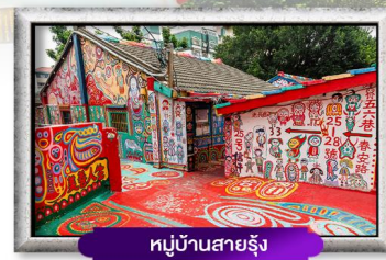
หมู่บ้านสายรุ้ง

เมนู สุดพิเศษ !! เสี่ยวหลงเปา 4 วัน 3 คืน อาหาร : 6 มื้อ เดินทาง มกราคม - มิถุนายน 67