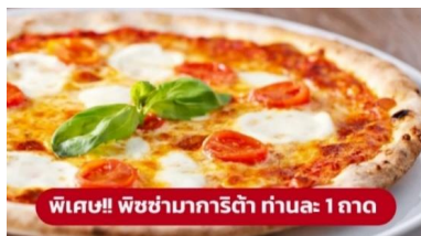
พิเศษ!! พิซซ่ามาริตต้า ท่านละ 1 ถาด

นำท่านเก็บภาพความประทับใจและถ่ายรูป 1 ใน 7 สิ่งมหัศจรรย์ของโลก หอเอนปิซ่า (Leaning Tower of Pisa) หอเอนปิซ่าที่สร้างขึ้นเพื่อเป็นหอรระฆังแห่งวิหารประจำเมือง แต่เพียงการเริ่มต้นของการสร้างถึงบริเวณชั้น 3 ก็เกิดการทรุดตัวและต้องหยุดการก่อสร้างจนถดถอยมาอีก 100 ปี ถึงได้สร้างต่อจนเสร็จสมบูรณ์ มหาวิหารปิซ่า (Cathedral of Pisa) มหาวิหารที่สวยงามที่สุดในลักษณะโรมันเนสส์ แสดงให้เห็นจากชายหอคีลจุ่ม กลางตัวมหาวิหาร และชาวหอรระฆัง ตัวมหาวิหารเป็นผังกางเขน มีนุขท้ายวัดและตกแต่งซุ้มโค้งรอบวัดภายนอกเป็นแบบแถบหินอ่อน สลับสีทางขวาง ซึ่งกลายมาเป็นแบบที่เรียกว่า "ลักษณะปิซ่า" และโดมรูปไข่และ Pisa Baptisty of St. John เป็นอาคารทางศาสนาคริสต์นิกายโรมันคาทอลิก จากนั้นนำท่านเดินทางสู่ เมืองมิลาน (Milan) (ระยะทาง 282 กม. / 4 ชั่วโมง)