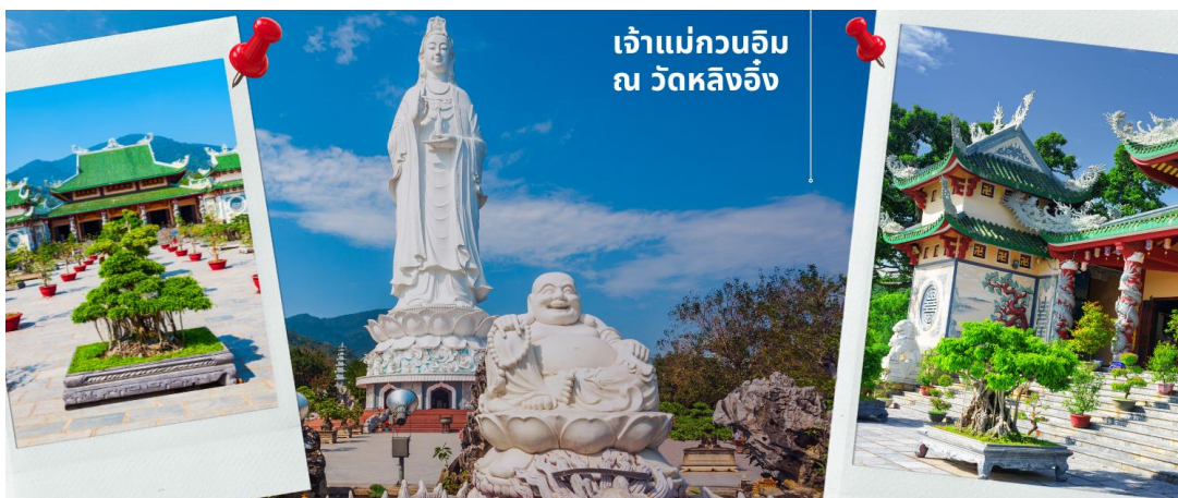
เจ้าแม่กวนอิม ณ วัดหลิงอิ่ง

นำท่านมัศจรรย์องค์ เจ้าแม่กวนอิม ณ วัดหลิงอิ่ง อยู่บนเกาะเซินตรา (Son Tra) ทางเหนือของเมือง ดานัง เป็นวัดใหญ่ที่สุดของที่นี่ รูปปั้นปูนขาวของเจ้าแม่กวนอิมยืนหันหลังให้ภูเขา หันหน้าออกสู่ทะเลเพื่อเป็นการปกป้องคุ้มครองชาวประมงที่ออกไปหาปลา เสี่ยงระฆังวัดที่ตีประสานกับเสียงคลื่นนั้นช่วยให้ ชาวเรือรู้สึกสงบ และสร้างขวัญกำลังใจอย่างดีเยี่ยม และเป็นที่เคารพนับถือของคนดานัง