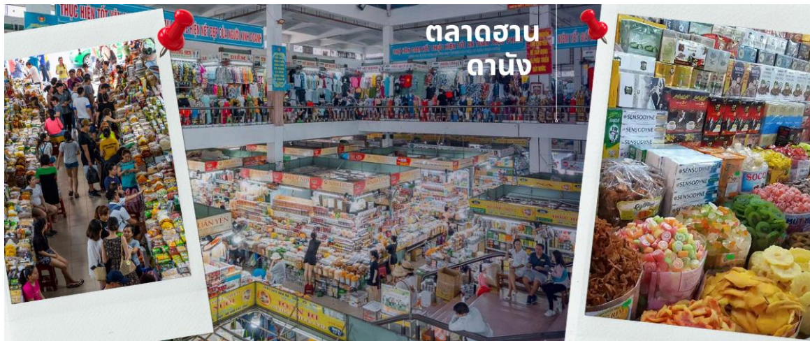
ตลาดฮาน ดานัง

นำท่านไปละลายทรัพย์ที่ ตลาดฮาน เป็นตลาดที่รวบรวมสินค้ามากมายเป็นที่นิยมทั้งชาวเวียดนามและชาวไทย อาทิ เสื้อเวียดนาม หมวก รองเท้า กระเป๋า สินค้าพื้นเมือง โดยเฉพาะงานฝีมือ อาทิ ภาพผ้าปักมืออันวิจิตร โคมไฟ ผ้าปัก กระเป๋าปัก ตะเกียบไม้แกะสลัก ชุดอ่าวหย่าย (ชุดประจำชาติเวียดนาม) ไว้เป็นที่ระลึกมากมายเพื่อฝากคนที่บ้าน