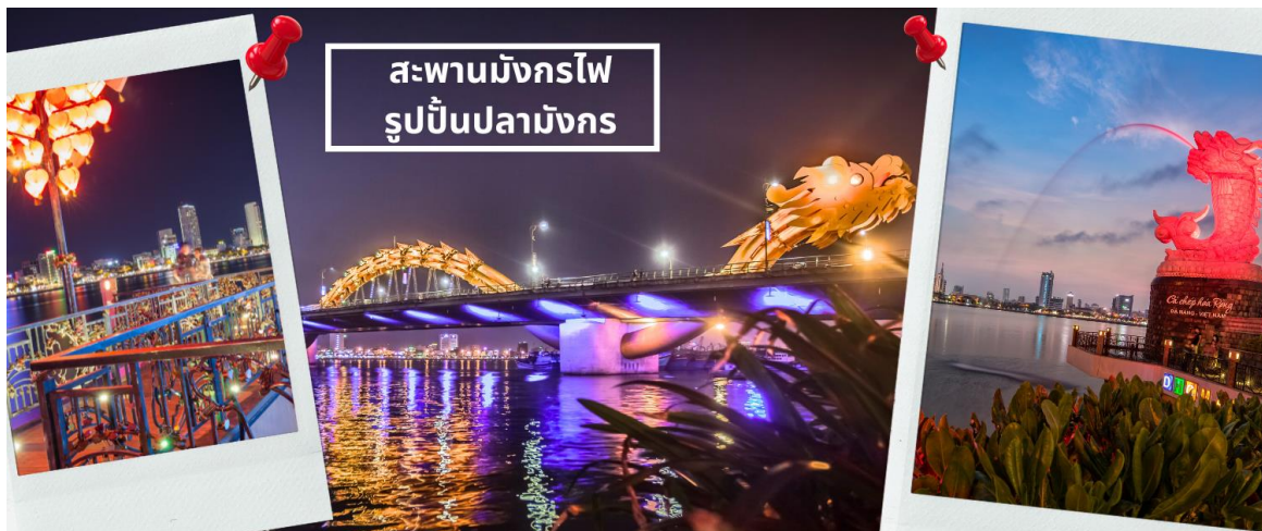
สะพานมังกรไฟ รูปปั้นปลามังกร

จากนั้นนำท่านชม สะพานแห่งความรัก ที่นิยมของหนุ่มสาวคู่รักกันมาซื้อกุญแจใส่คล้องใส่สะพาน จากนั้นนำท่านชม รูปปั้นปลามังกร ที่เป็นสัญลักษณ์ของเมืองดานัง เมืองที่กำลังจากปกกลายเป็นมังกรในระยะใกล้ เชิญท่านเพลิดเพลินกับความอลังการของ สะพานมังกรไฟ ที่มีความยาวถึง 666 เมตร เป็นสะพาน 6 เลนส์ ซึ่งเป็นสะพานที่ตระการตามากที่สุดของเวียดนามในเวลานี้โดยการแสดงนี้จะเริ่มเวลา 21.00น. ของวันเสาร์ และอาทิตย์เท่านั้น