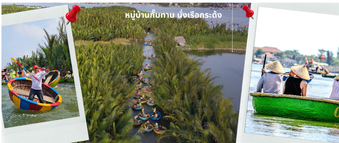
หมู่บ้านก๊มทาน นั่งเรือกระดัง

จากนั้นนำท่านผ่านชม ภูเขาหินอ่อน Marble Mountains และนำท่านเข้าชม หมู่บ้านแกะสลักหินอ่อน ที่มีแหล่งวัตถุหินอ่อนเนื้อดี และช่างแกะสลักฝีมือประณีต ส่งออกจำหน่าย ทั่วโลก จากนั้นนำท่านเดินทางสู่ หมู่บ้านก๊มทาน สนุกสนานไปกับการเล่นกิจกรรม นั่งเรือกระดัง เป็นหมู่บ้านเล็กๆในเมืองฮอยอันตั้งอยู่ในสวนมะพร้าวริมแม่น้ำ ในอดีตช่วงสงครามที่นี่เป็นที่พักอาศัยของเหล่าทหาร อาชีพหลักของคนที่นี่คืออาชีพประมง ระหว่างการล่องเรือท่านจะได้ชมวัฒนธรรมอันสวยงาม ชาวบ้านจะขับร้องเพลงพื้นเมือง ผู้ชายกับผู้หญิงจะหยอกล้อกันไปมาหน้าที่พายเรือมาเคาะกันเป็นจังหวะดนตรีสุดสนุกสนาน