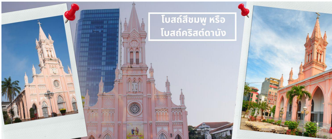
โบสถ์สีชมพู หรือ โบสถ์คริสต์ดานัง

แวะเลือกซื้อผลิตภัณฑ์จากร้านเยื่อไผ่ จากนั้นนำท่านไป โบสถ์สีชมพู หรือ โบสถ์คริสต์ดานัง (Danang Cathedral) เป็นโบสถ์ที่มีความสำคัญเนื่องจากเป็นจุดเริ่มต้นของศาสนาคริสต์ในเวียดนาม สร้างขึ้นในสมัยที่เวียดนามตกเป็นอาณานิคมของฝรั่งเศสเป็นสถาปัตยกรรมในสไตล์โกธิก พร้อมด้วยการตกแต่งอย่างสวยงาม ประณีต ที่สำคัญคือเป็นโบสถ์สีชมพูพาสเทลทั้งหลัง ตัดขอบด้วยสีขาว ดูละมุนตาสุด ๆ