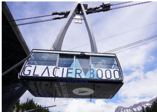
Highlight! กระเช้าไฟฟ้าขนาดยักษ์ที่จุผู้โดยสารได้ถึง 125 คน

แขวนที่มีความยาว 107 เมตร ข้ามหน้าผาที่ระดับความสูง 3,000 เมตร ทำให้เป็นสะพานแขวนที่สูงที่สุดในโลก อีสรະให้ท่านสนุกสนานกับกิจกรรมตามอริยาศัย (ราคาทัวร์รวม Peak walk and View point / Glacier Walk / Ice Express (chairlift) / Fun Park กรุณาเช็คเครื่องเล่นต่างๆ กับหัวหน้าทัวร์อีกครั้ง)