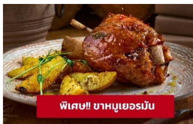
พิเศษ! ขาหมูเยอรมัน

นำท่านเดินทางสู่ เมืองมิวนิก (Munich) (ระยะทาง 127 กม./ 2.30 ชม.) เป็นหนึ่งในเมืองมั่งคั่งที่สุดของยุโรป มีพรมแดนติดเทือกเขาแอลป์ พาทุกท่านไปเช็คอินสถานที่ชื่อดังที่มีความสำคัญของเมืองมิวนิก จากนั้นนำท่านสู่บริเวณ มาเรียนพลาทซ์ (Marienplatz) จตุรัสกลางใจเมืองในเขตเมืองเก่า ปัจจุบันที่เป็นเหมือนพื้นที่สำหรับงานพิธีต่างๆ ที่สำคัญของเมือง ถัดมาเป็น ศาลาว่าการใหม่ (New Town Hall) ที่ได้ใช้ทำการแทนศาลาว่าการเก่าตั้งแต่ปี 1874 เห็นได้ง่ายด้วยหอคอยแหลมสูงและการออกแบบและตกแต่งอย่างประณีตไม่แพ้ปราสาทหรือพระราชวัง บริเวณใกล้กันนั้นเป็น ศาลาว่าการเก่า (Old Town Hall) เป็นอาคารสีขาวสะอาดหลังนี้เป็นศาลาว่าการของเมืองมิวนิกมาตั้งแต่ปี 1310 แม้จะผ่านมากกว่า 700 ปี แต่ก็ยังสวยและสง่า มหาวิหารเฟราเอิน (Frauenkirche Cathedral) เป็นโบสถ์ทางคริสต์ศาสนาที่เก่าแก่และผ่านประวัติศาสตร์ช่วงสงครามโลก จุดเด่นของโบสถ์แห่งนี้คือ โดมหอมหิวใหญ่สีฟ้า